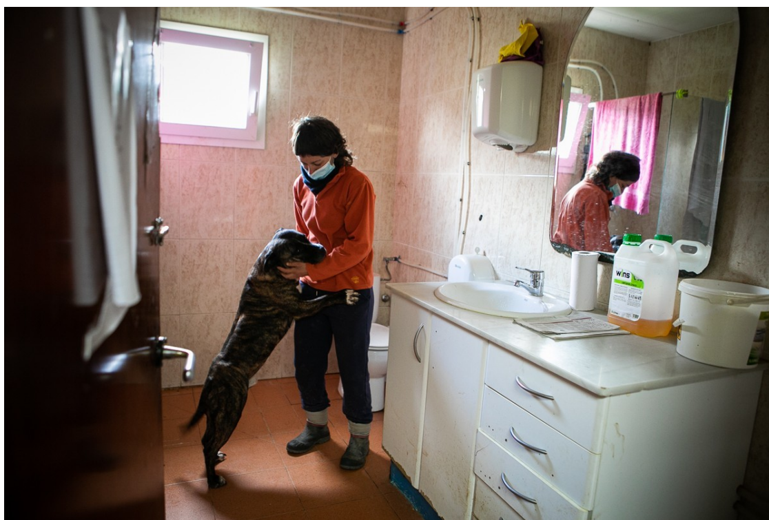
El gos Tigre viu al lavabo de Terra Viva.