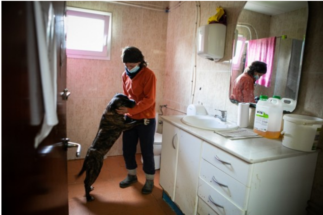
El gos Tigre viu al lavabo de Terra Viva.

A Terra Viva pensen que el centre de recollida d'animals "no compleix amb els requisits de capacitat i adequació necessaris" per a donar un servei correcte ni garantir la seguretat, no només dels animals sinó també dels treballadors que s'hi escarrassen amb cura i estima per les bèsties.