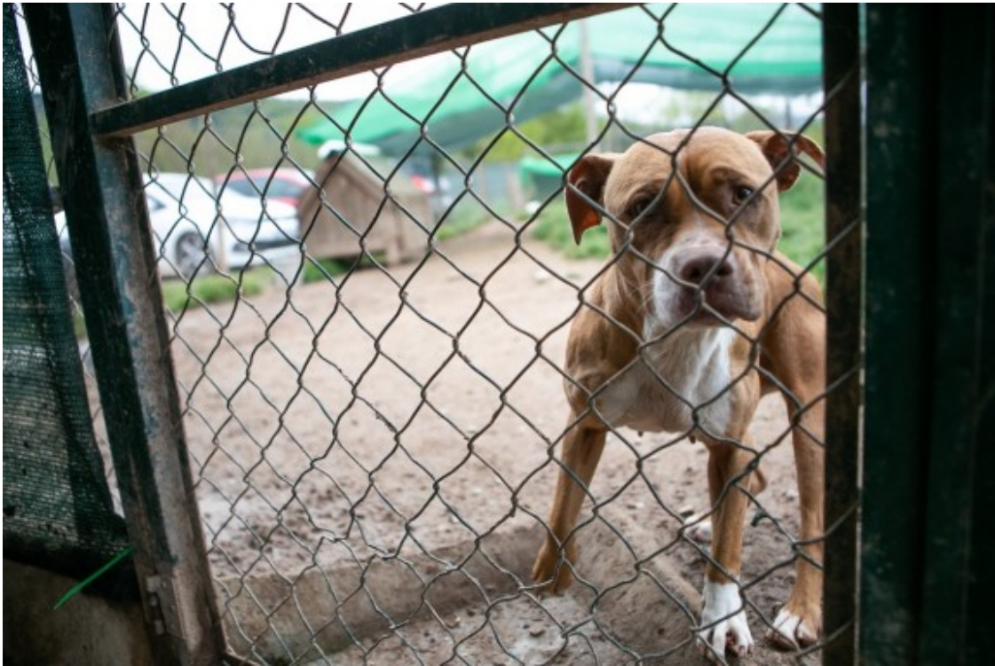
La gossa Lua viu moltes hores al despatx de la protectora.