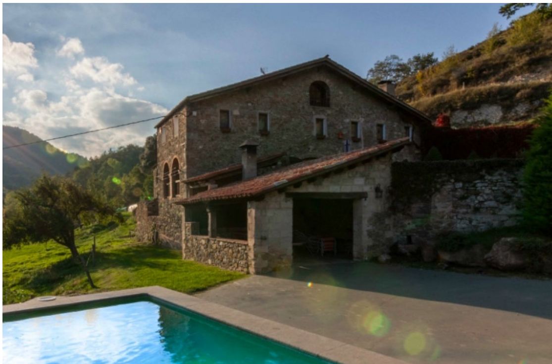
Una casa de turisme rural a la Vall de Bianya, a la Garrotxa. | SomRurals.

El sector s'uneix per a reclamar la represa de l'activitat i ajudes econòmiques per a minimitzar els efectes de les mesures imposades arran de la pandèmia