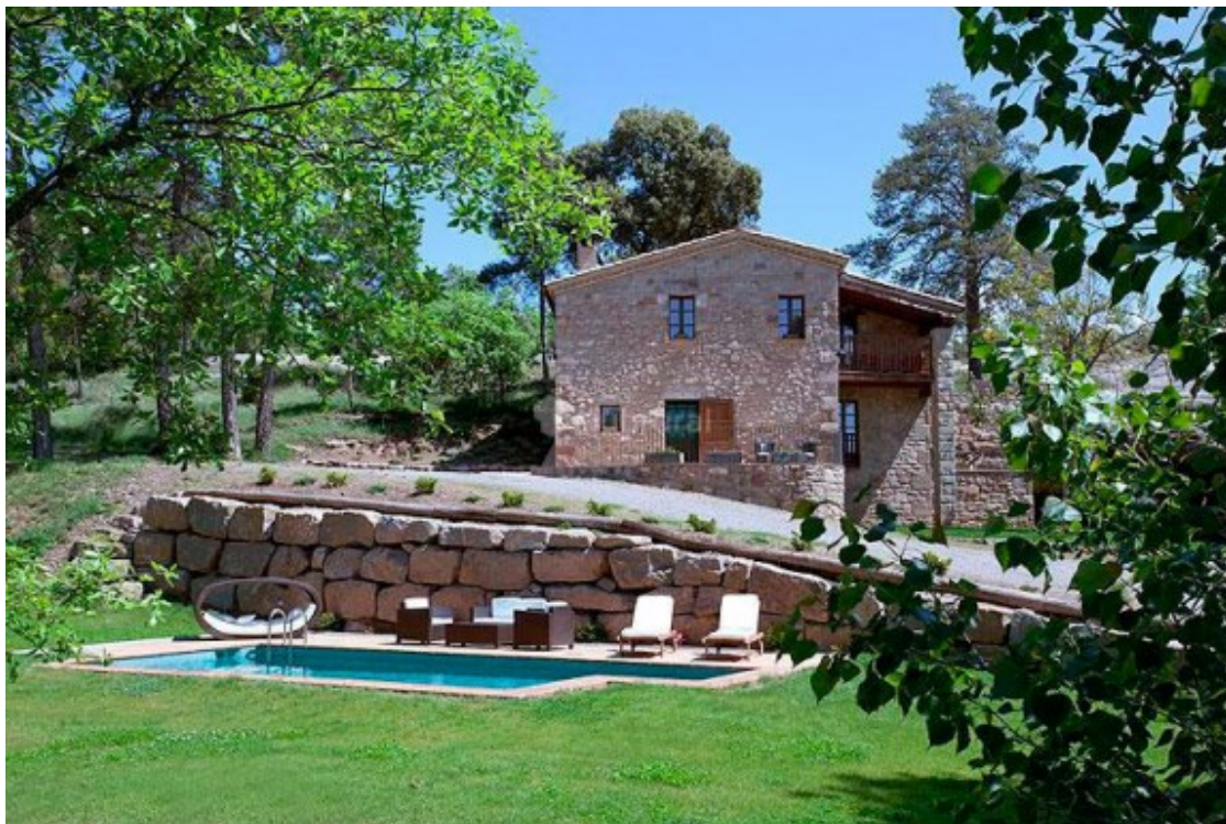
Un allotjament rural al Vallès Oriental.

Finalment, també es reclamen ajudes econòmiques per a minimitzar l'afectació que tindran els més de 2.400 allotjaments rurals que representen.