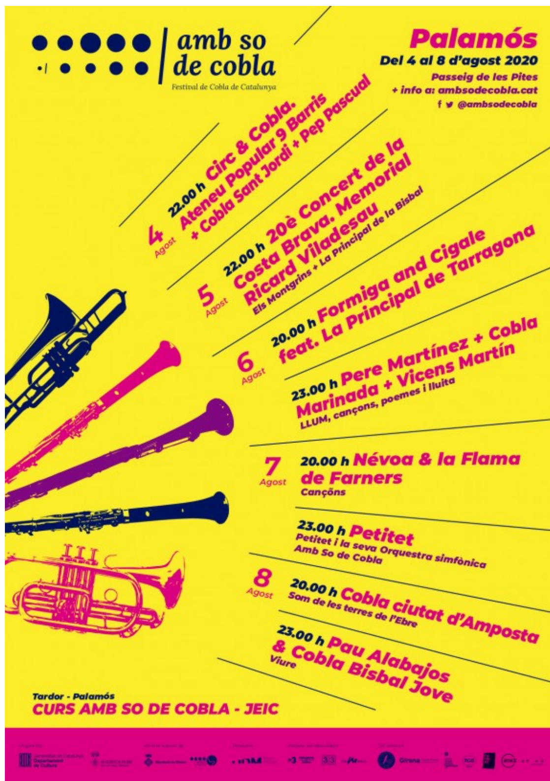
Cartell de la quarta edició del festival Amb So de Cobla.