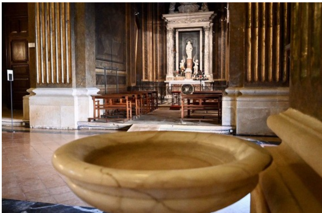
La catedral de Vic, sense aigua beneïda.

A Súria, on se celebren les caramelles més grans del país, ( https://www.naciodigital.cat/noticia/199934/suria/traslladara/caramelles/mes/grans/catalunya/balcans/finestres/vila ) l'escenari seran les xarxes socials i els balcons i finestres de la vila, on s'ha organitzat un programa d'activitats organitzat per la Comissió de Caramelles, que ha batejat amb el nom de Conficaramelles 2020 el cicle musical.