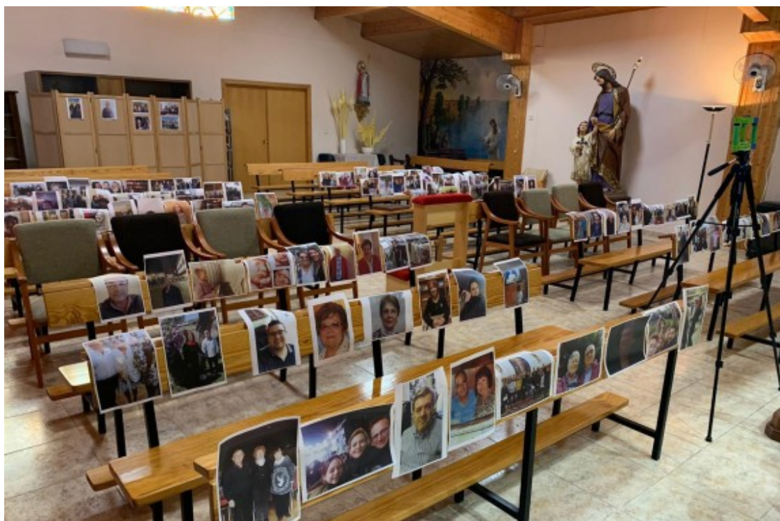
Les imatges dels feligresos sobre els bans de la parròquia Sant Miquel de la Cava.