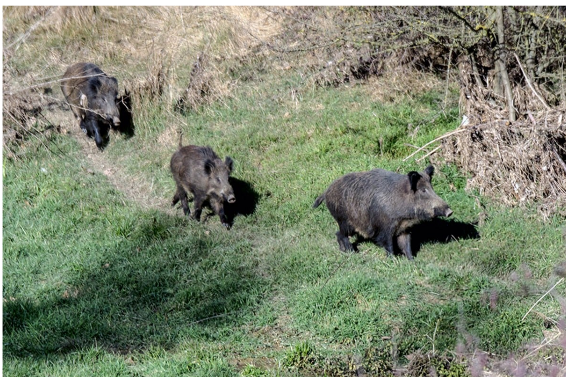
Tres senglars en un corriol de muntanya. | Carme Molist.

Per contra, als observatoris de les Gavarres, Sant Llorenç del Munt, Prades i el massís del Garraf el nombre d'exemplars va augmentar