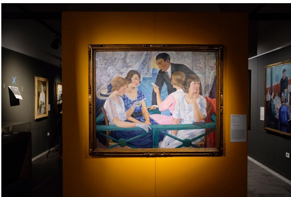
El «Palco d'envelat» (1921), de Francesc Vayreda presideix l'entrada a l'exposició. | Martí Albesa.

"Realismes a Catalunya, 1917-1936. Del Picasso clàssic al Dalí surrealista" ?iniciativa dels museus de d'Olot, Sitges i Valls, comissariada per Mariona Seguranyes?, s'inaugura aquest 1r de febrer