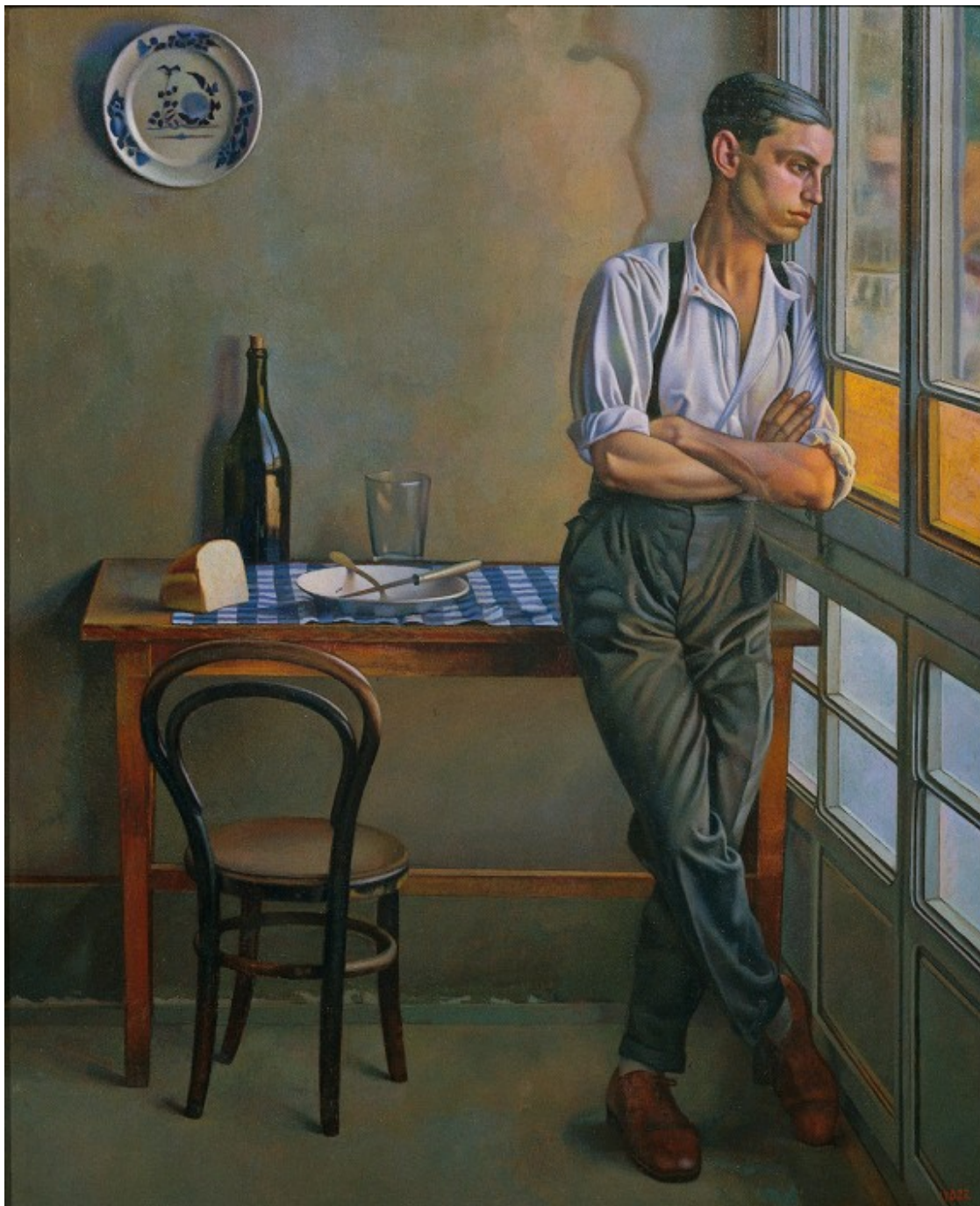
L'obra de Feliu Elias «La galeria» és el fil conductor de l'exposició, el catàleg i el program de mà.

Dissabte 16 de maig, a les 21 h, Pati de l'Hospici Acció performàtica amb el col·lectiu nyam-nyam.