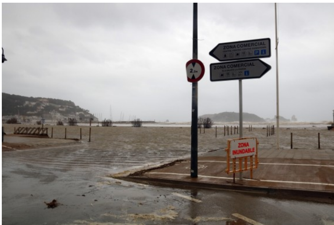
La llevantada ha afectat zones urbanes