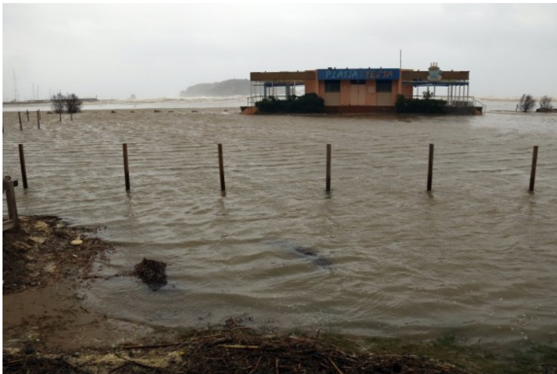
L'aigua ha passat per sobre de les platges de l'Estartit

algunes pedres alhora que saltaven amb força per sobre de l'escullera. A les platges d'Els Salats i a la dels Griells l'aigua també ho ha inundat tot. En aquest últim indret, l'aigua salada ha inundat les instal·lacions del càmping El Molino, a primera línia de mar.