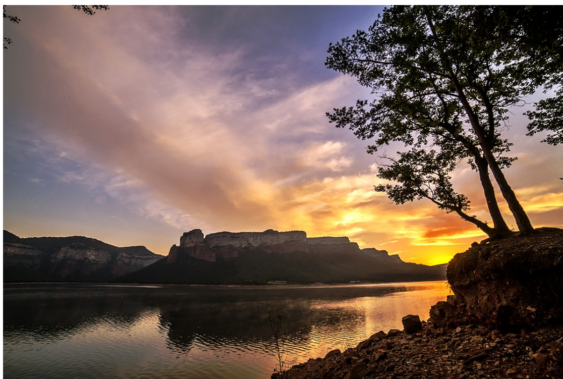
La sortida de sol des del pantà de Sau

A les 17.54 comença oficialment l'estiu, que durarà 93 dies i 15 hores i acabarà el 23 de setembre