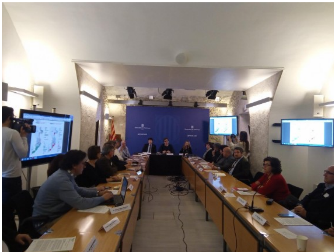
Reunió, avui, de la Comissió territorial d'urbanisme de Girona | @gencat.

El Departament de Territori i Sostenibilitat redacta el nou Pla director urbanístic que analitzarà l'ordenació de tots els sòls pendents de desenvolupar