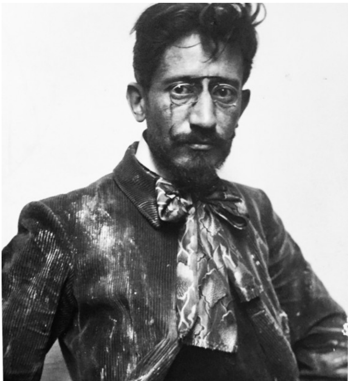
Josep Berga i Boada és motiu de la mostra que s'inaugura en plenes Festes del Tura

«En Pep Berga i Boada, [...] encara que fill de sanch y d'art d'en Josep Berga y Boix, s'assembla al pare igual que un ou i una castanya. Aquest de geni apacible, campetxano y metòdich, i aquell de caràcter mogut, nerviós y descuidat [...], bellugadís, atrevit y esbojarrat, s'ha llensat de bonas a primeras i ab pochots borts ha muntat sobre el tamboret [...] Com casi tots els artistes d'avuy, en Berga rendeix culte a l'anomenat modernisme si bé sols prenent-lo per son aspecte decoratiu en cual gènere fa gala d'una inventiva y d'un bon gust poch comuns.»