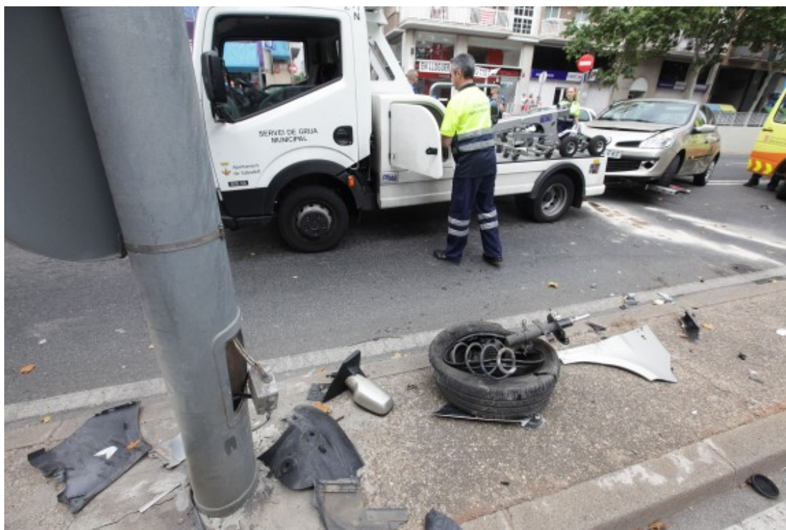
La grua municipal de Sabadell retirant un vehicle accidentat.

L'aigua no és l'únic front de la capital catalana, i ha obert processos per remunicipalitzar alguns serveis petits, com els Punts d'Informació d'Atenció per a les Dones (PIAD) i el Servei d'Atenció, Recuperació i Acollida (SARA); escoles bressol i BTV. L'ajuntament també vol impulsar una comercialitzadora pública d'energia elèctrica generada a Barcelona, que la compri de fonts renovables públiques i privades, i la vengui a llars i ens municipals, cosa que podria activar-se l'octubre del 2018. A més, crearà una funerària pública ( http://www.naciodigital.cat/noticia/119573/barcelona/creara/funeraria/publica/rebaixar/30/cost/morir-se ), amb un mínim d'un tanatori, per rebaixar un 30% els preus dels serveis funeraris sense perdre qualitat, iniciativa que podria posar-se en marxa el 2019, a les acaballes del mandat. Aquest cas suposarà que el consistori es desprengui del 15% que encara conserva a Serveis Funeraris de Barcelona (SFB), que ara domina el mercat gairebé per complet, i el 85% del qual és de Mémora. Aquí el consistori no s'ha atrevit a remunicipalitzar, sinó que pretén obrir la competència per aconseguir abaratir el servei.