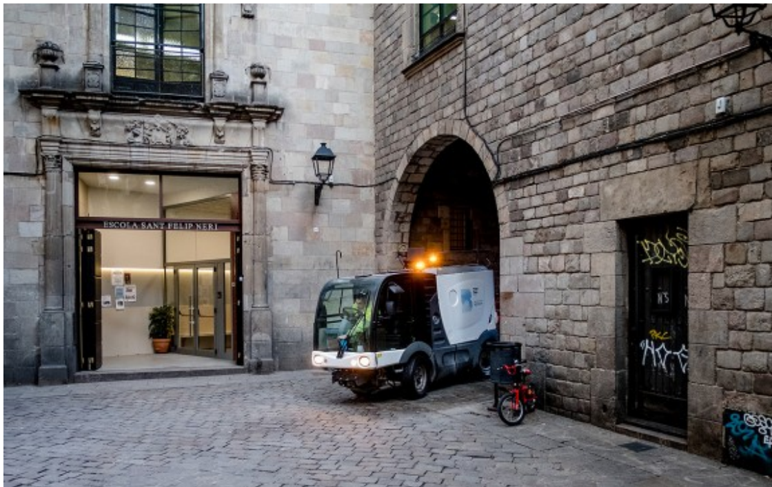
Un vehicle de la brigada de neteja a la plaça Sant Felip Neri de Barcelona.