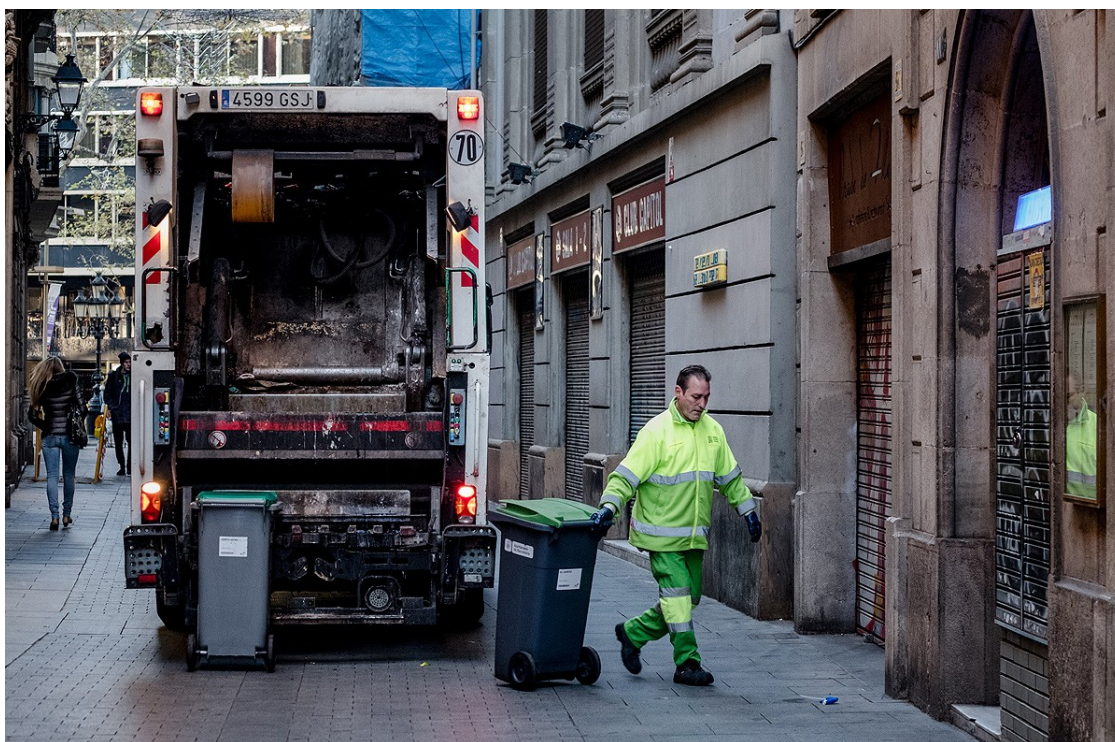
Recollida del vidre al districte de Ciutat Vella de Barcelona, on està adjudicada a FCC

Els consistoris catalans debaten si recuperar la prestació directa de serveis essencials, com l'aigua i la recollida d'escombraries | Les presumptes irregularitats de FCC a Barcelona i Badalona obliguen a revisar els contractes amb grans empreses | El debat es reproduïx a tot el món i més de 100 milions de persones ja viuen en ciutats amb el servei d'aigua remunicipalitzat