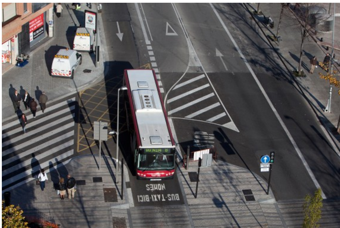
Un bus circulant per la Rambla d'Ègara de Terrassa.