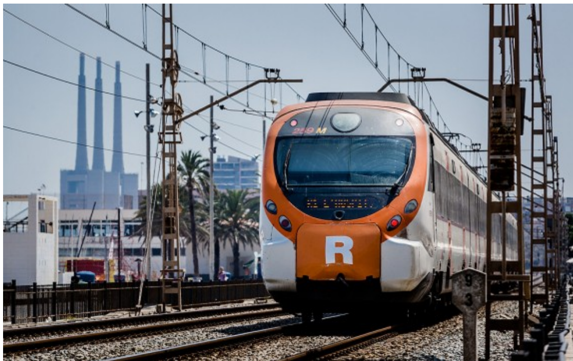
Un comboi circulant per Badalona.

Permet saber horaris, mapes i quines és l'estació més propera