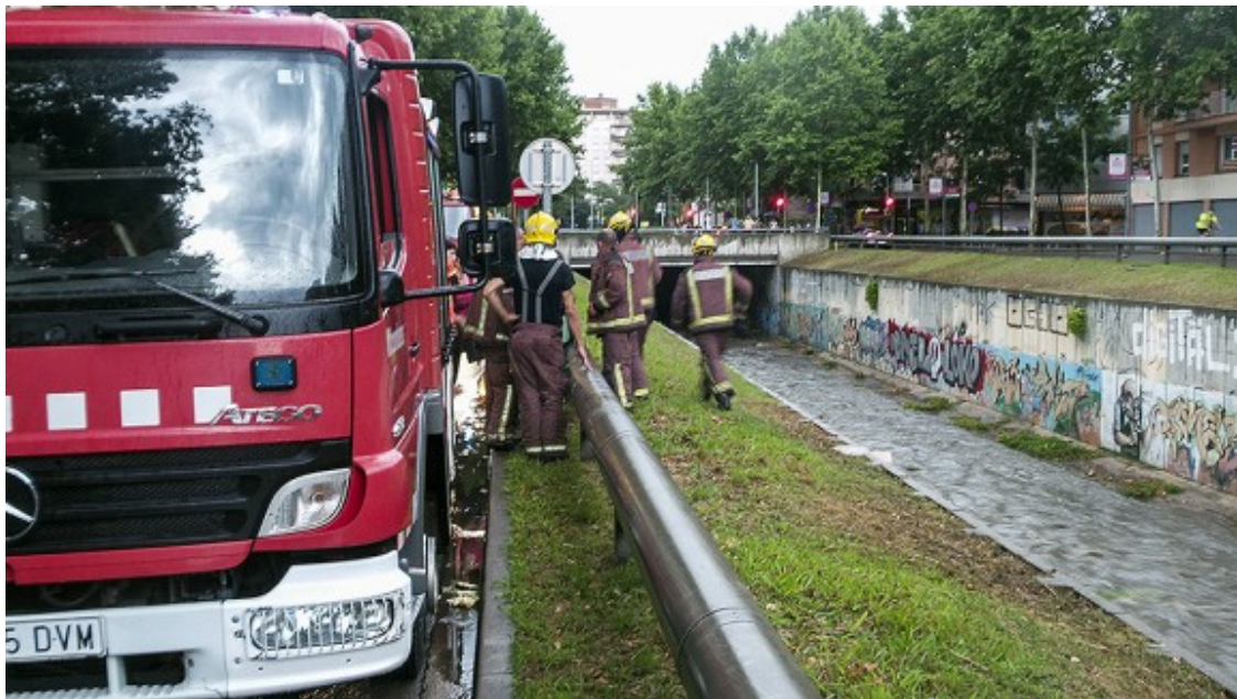
Els Bombers treballant en el rescat.