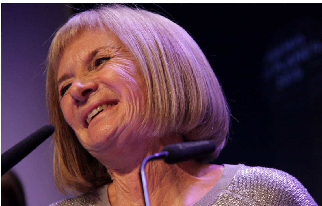
Alicia Giménez Bartlett, guanyadora del Premi Planeta