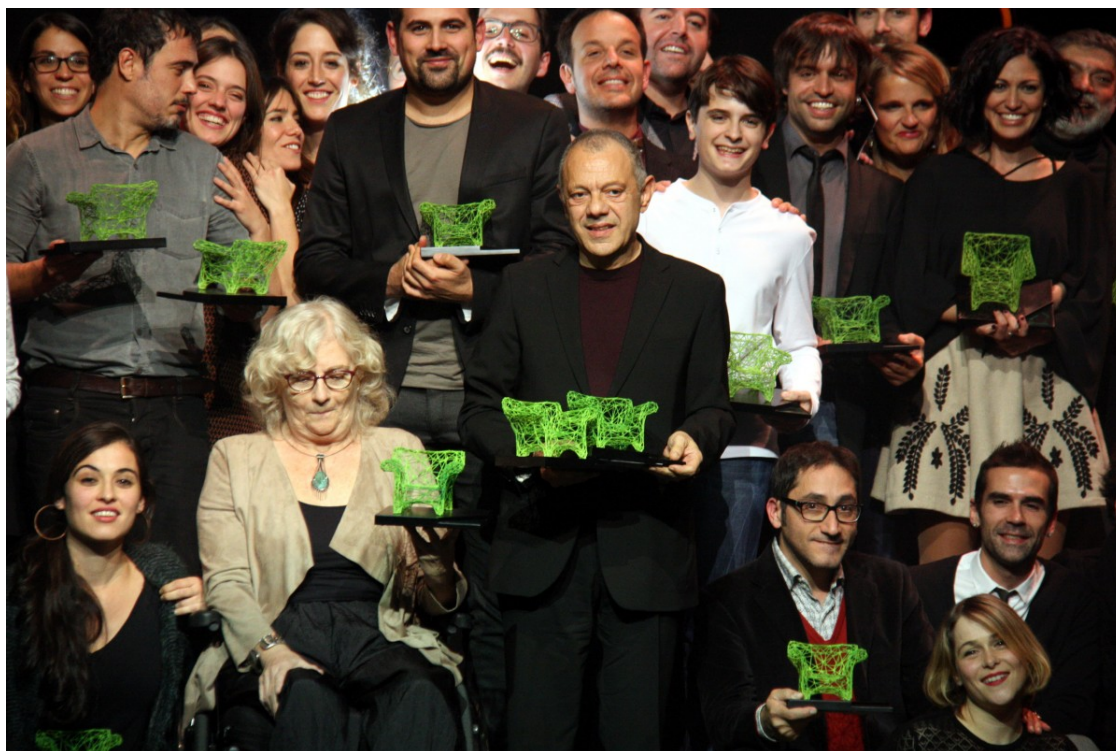
Foto dels premiats als Butaca amb Lluís Pasqual, director d'«El Rei Lear» al centre