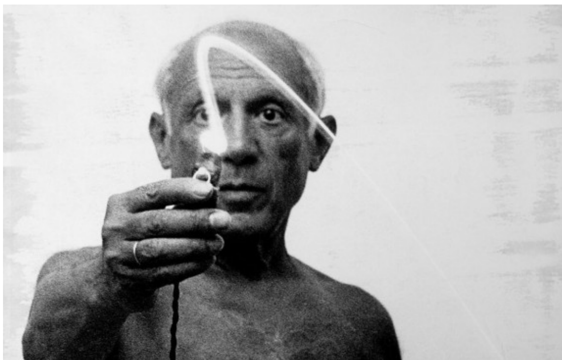
Picasso retratat per Gjon Mili

"Cal recordar que la primera il·lustració que publica Picasso apareix a L'esquella de la Torratxa ", anoten Boada i Vallès. És en tot aquell ambient extraordinari de principis de segle XX -amb una Catalunya sensible, cultivada i amb gust per l'art que provenia de les avantguardes europees- on Picasso forja un mite i on es mou com peix a l'aigua. "La cultura castellana estava encasellada, i la modernitat era aquí, a Barcelona", explica Boada. En aquest sentit, és cèlebre -la frase amb la qual el propi pintor es solia definir: "sóc un català nascut a Màlaga que viu a París".