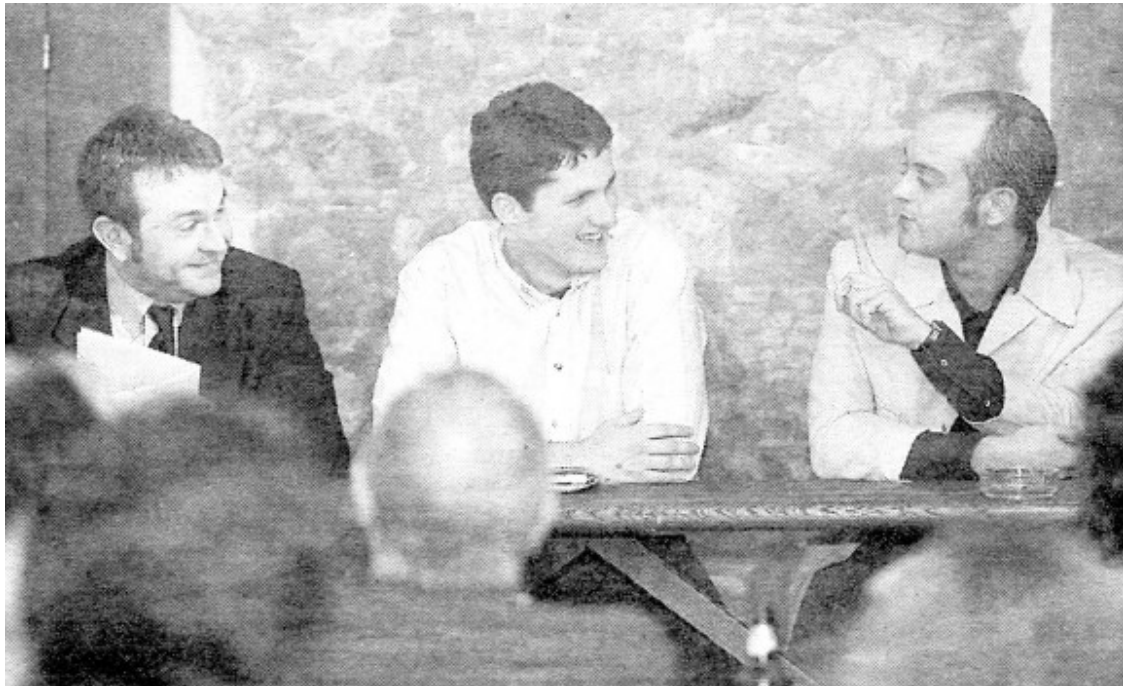
La premsa de l'època es feia ressò del primer acte d'en Pedrals, un debat sobre Carner