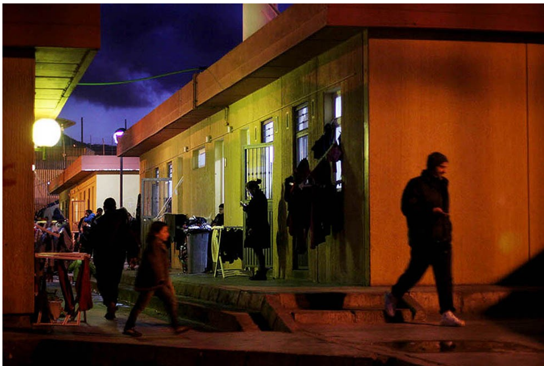
Imatge de l'interior del CETI de Melilla, a la nit.