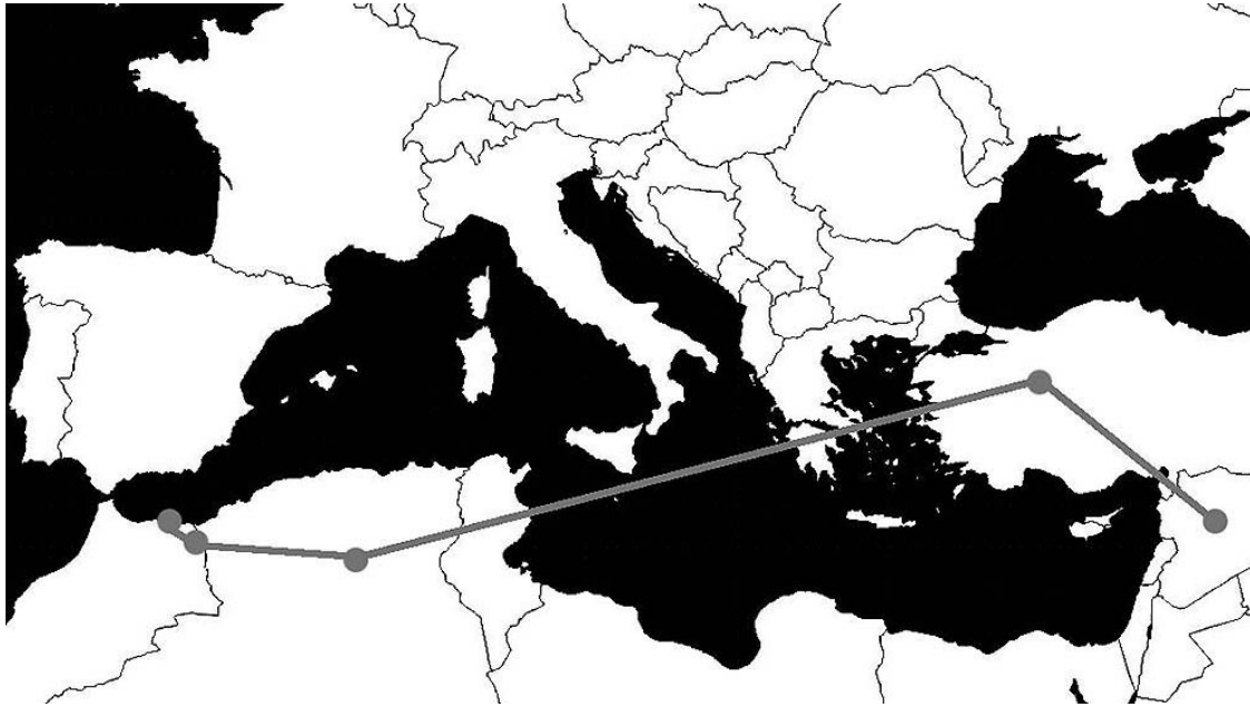
Ruta utilitzada pels sirians, evitant el perillós viatge del Mediterrani, i arribant a Europa a través de Melilla.