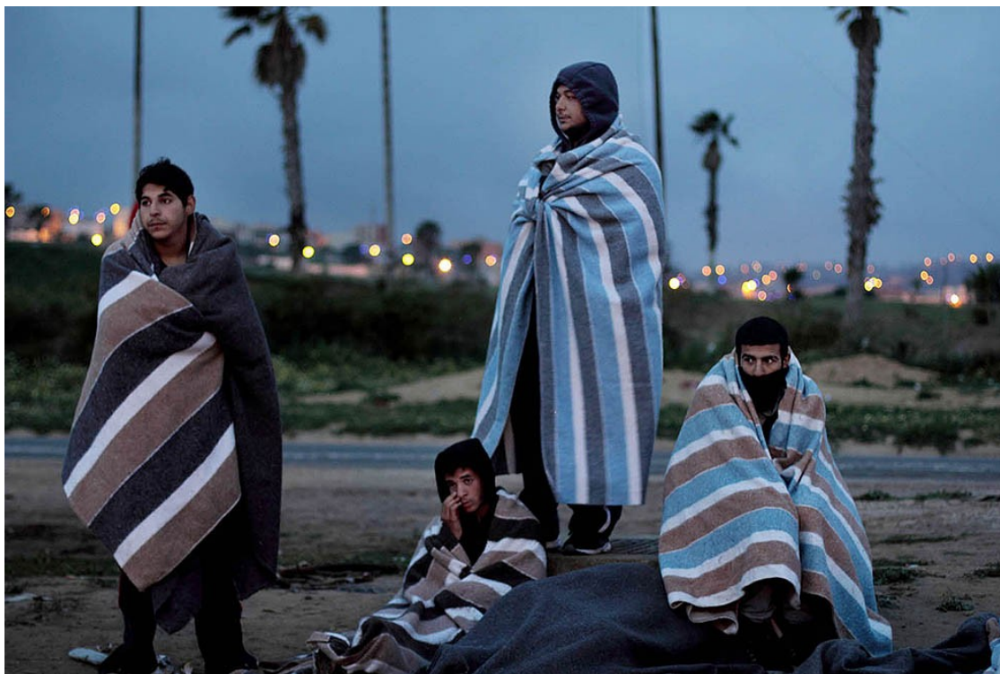
Uns homes sirans es desperten de matinada davant del CETI, després de dormir al carrer com a protesta per la llarga espera a Melilla.

"Salida?". És la paraula més comentada i esperada entre tota la població del CETI. Cada sortida de persones cap a la península amb el vaixell és rebuda amb alegria per la majoria siriana del centre. Molts surten a acomiadar-les i cantar per celebrar-ho. I somien amb el dia en què serà la seva "salida".