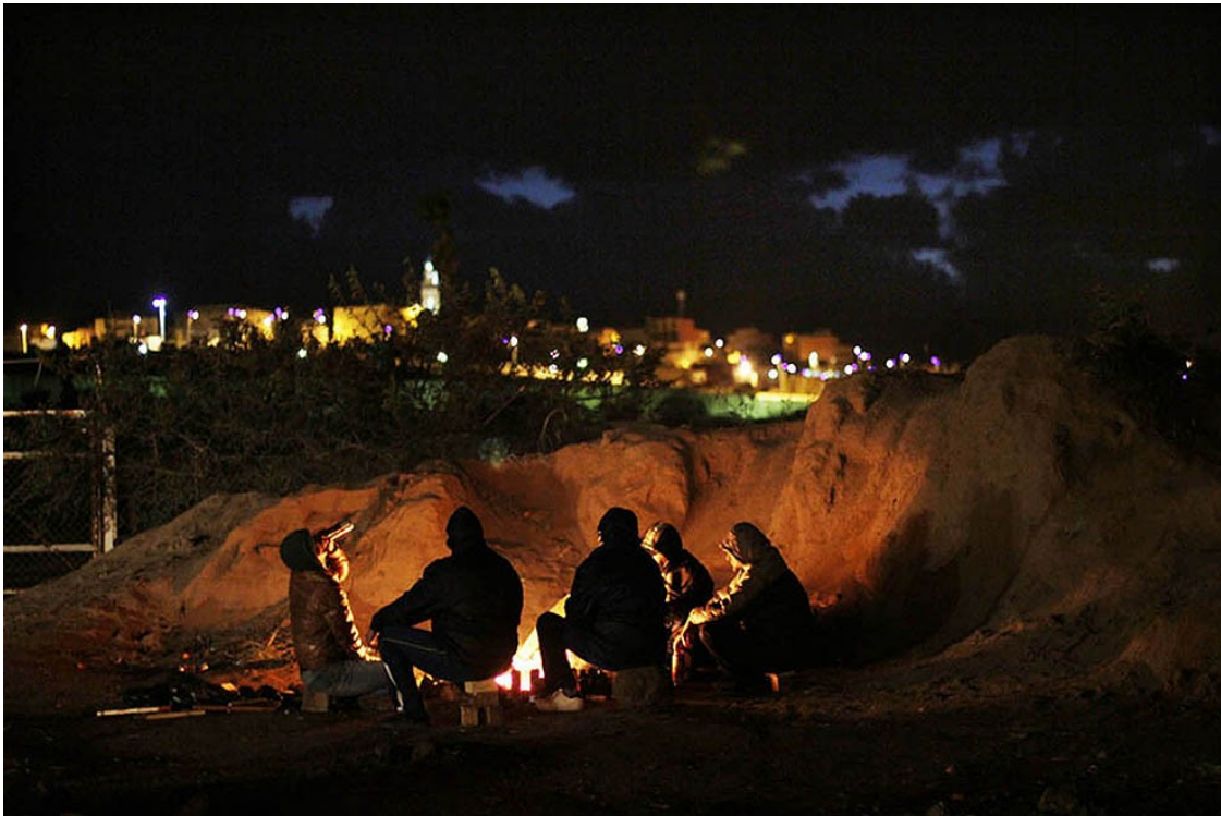
Uns homes sirians passen l'estona fora del CETI de Melilla.

Aquest temps d'espera, moltes vegades, és de diversos mesos. Els sirians només poden comptar els dies que van passant, desitjant veure el seu nom posat a la llista del CETI, que anuncia la sortida cap a la península.