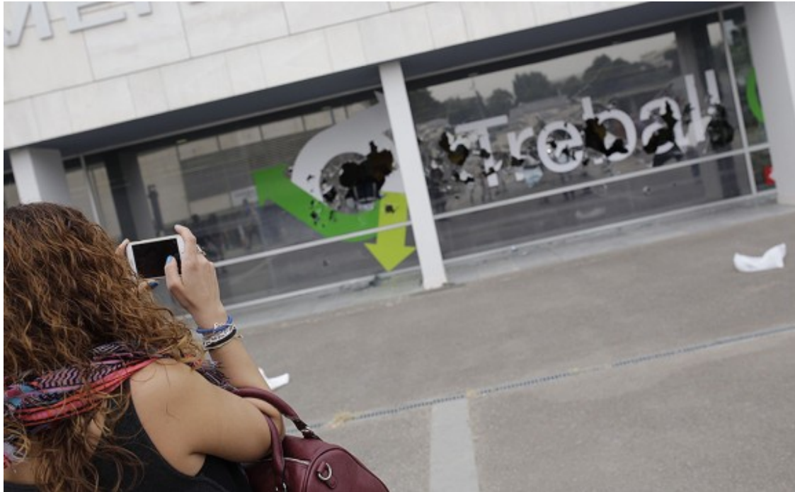
Una noia fotografia les destrosses dels piquets.

del migdia una manifestació a la plaça Universitat. També s'han organitzat protestes a Terrassa, Berga, Girona, Lleida, Santa Coloma de Gramenet i Palma. Es preveu que es desplacin fins a Barcelona columnes provinents del Maresme i Palautordera.