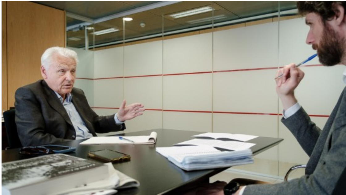
Tot i parlar-ne amb Trias, finalment no formarà part de la seva llista.

- El seu nom, però, hauria encaixat, pel que desplega, amb la candidatura que prepara Trias. Li va arribar a oferir?