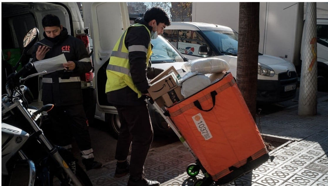
Un repartidor de paqueteria a domicili, en imatge d'arxiu

La patronal del repartiment a domicili porta el nou gravamen municipal, una de les mesures estrella del govern de comuns i PSC, al TSJC amb l'argumentació que és "discriminatori" i "ataca els principis tributaris"