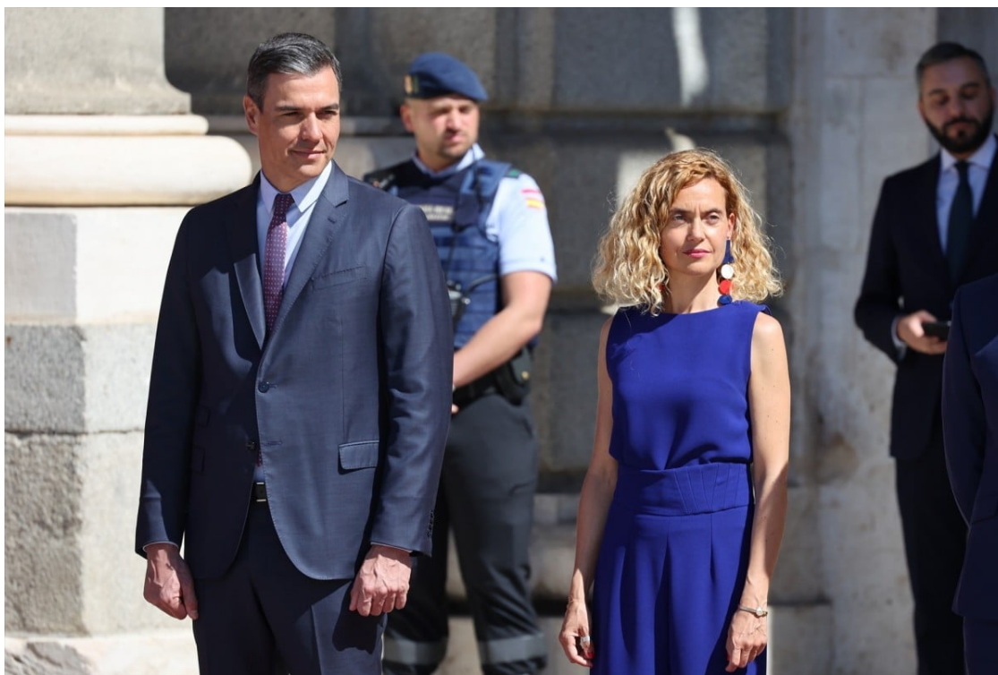
Pedro Sánchez i Meritxell Batet en una imatge d'arxiu.

Els expresidents espanyols tenen dret al 80% del sou durant un màxim de dos anys, oficina i l'opció d'ingressar al Consell d'Estat, mentre que els expresidents del Congrés poden rebre un percentatge del sou a més de cotxe oficial i escorta, però no pensió vitalícia