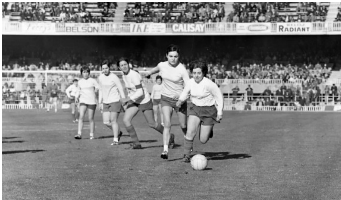
El partit de futbol femení entre la selecció de Barcelona, antecedent del Barça femení, i el Centelles, disputat al Camp Nou el Nadal de 1970

L'equip pioner del futbol femení a la península Ibèrica va ser, doncs, una de les primeres víctimes del conflicte bèl·lic que assoliria el món entre juliol de 1914 i novembre de 1918. La cosa no deixa ser de curiosa, ja que la desaparició de la pràctica del futbol femení a l'estat espanyol contrasta amb la revifalla que aquest esport va viure en diversos dels països que participaven en el conflicte a causa del trasllat de bona part dels homes en edat de combatre al camp de batalla i a la necessitat de distreure la rereguarda amb activitats lúdiques i esportives.