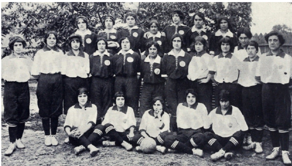
La plantilla de l'Spanish Girl's Club que va jugar el primer partit de futbol femení de la península Ibèrica el 1914

Coincidint amb el 8-M, fem memòria del primer equip de futbol femení de Catalunya i de l'Estat, que va veure com l'esclat de la Primera Guerra Mundial provocava la seva dissolució