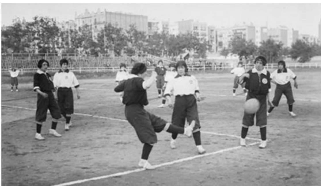
Els dos equips sorgits de l'Spanish Girl's Club s'enfronten a l'estadi de l'Espanyol el 9 de juny de 1914