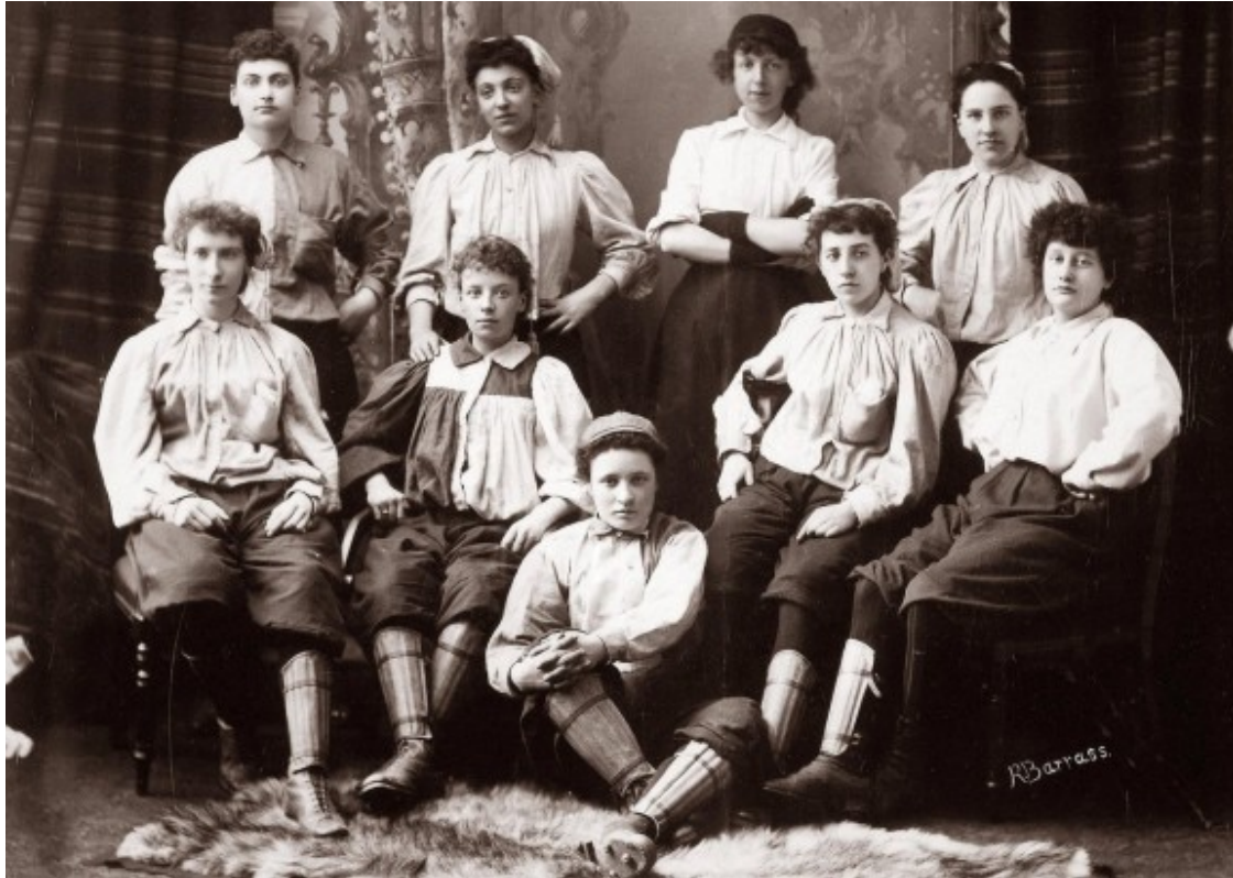
Les British Ladies, el primer equip de futbol femení de la història, creat al Regne Unit el 1895

Convençut del potencial esportiu del gènere femení, Bru va importar a Catalunya la idea que les British Ladies havien posat en pràctica al Regne Unit, que com hem vist havia tingut una curta durada i que no havia estat gens ben acollida per la federació anglesa fins al punt que, el 1902, havia decidit posar totes les traves possibles a la pràctica del futbol femení.