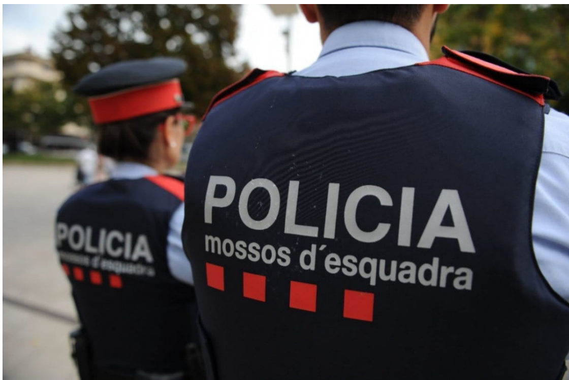
Agents dels Mossos, en una imatge d'arxiu

La investigació de la policia catalana identifica elements que proven la ideologia extremistista i violenta dels acusats per l'apunyament d'un noi d'origen senegalès durant la festa major del municipi