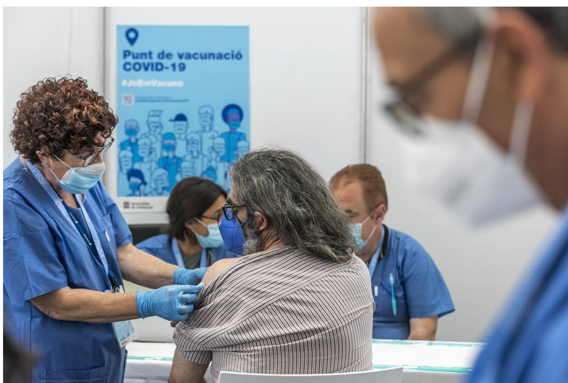
Vacunació contra la Covid, en una imatge d'arxiu | Juanma Peláez

La protecció contra el coronavirus es fa simultàniament amb la de la grip en una campanya de vacunació que s'estendrà fins al 30 de novembre