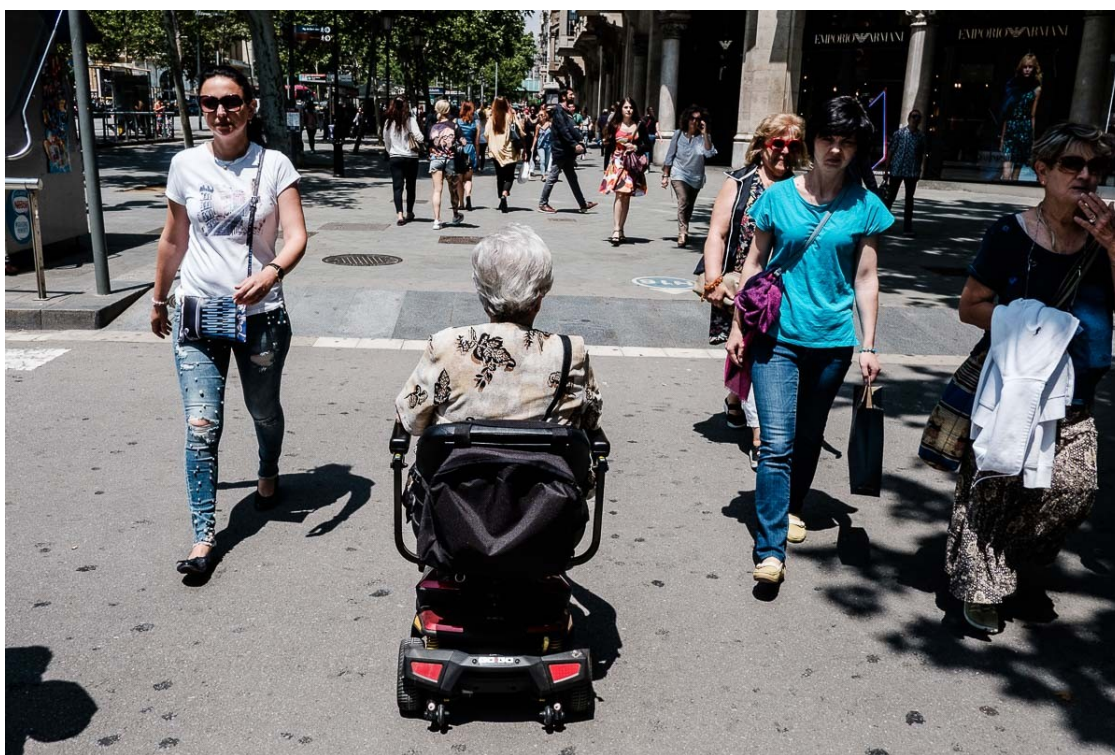
Una senyora amb cadira de rodes circulant pel passeig de Gràcia

La capital catalana és una de les cinc ciutats que han avaluat la Fundació ONCE i IdenCity amb una metodologia pionera per mesurar el grau d'accessibilitat i inclusió