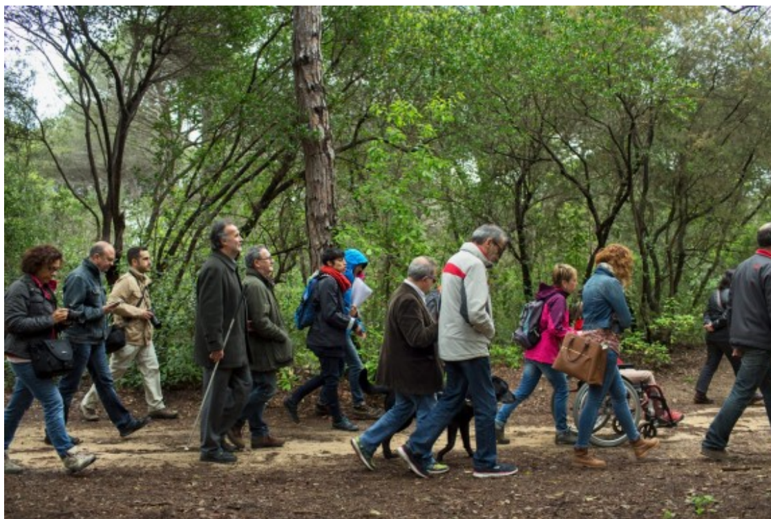
Imatge d'una ruta inclusiva teatralitzada

La dimensió de la recreació analitza el grau d'accessibilitat a activitats i espais relacionats amb l'oci i el temps lliure, amb uns resultats mitjans per sobre del 60% i que situen Barcelona en tercera posició, amb un 59,5% . En general, totes les ciutats avaluades continuen tenint per davant reptes per garantir la participació de les persones amb discapacitat en les activitats de temps lliure.