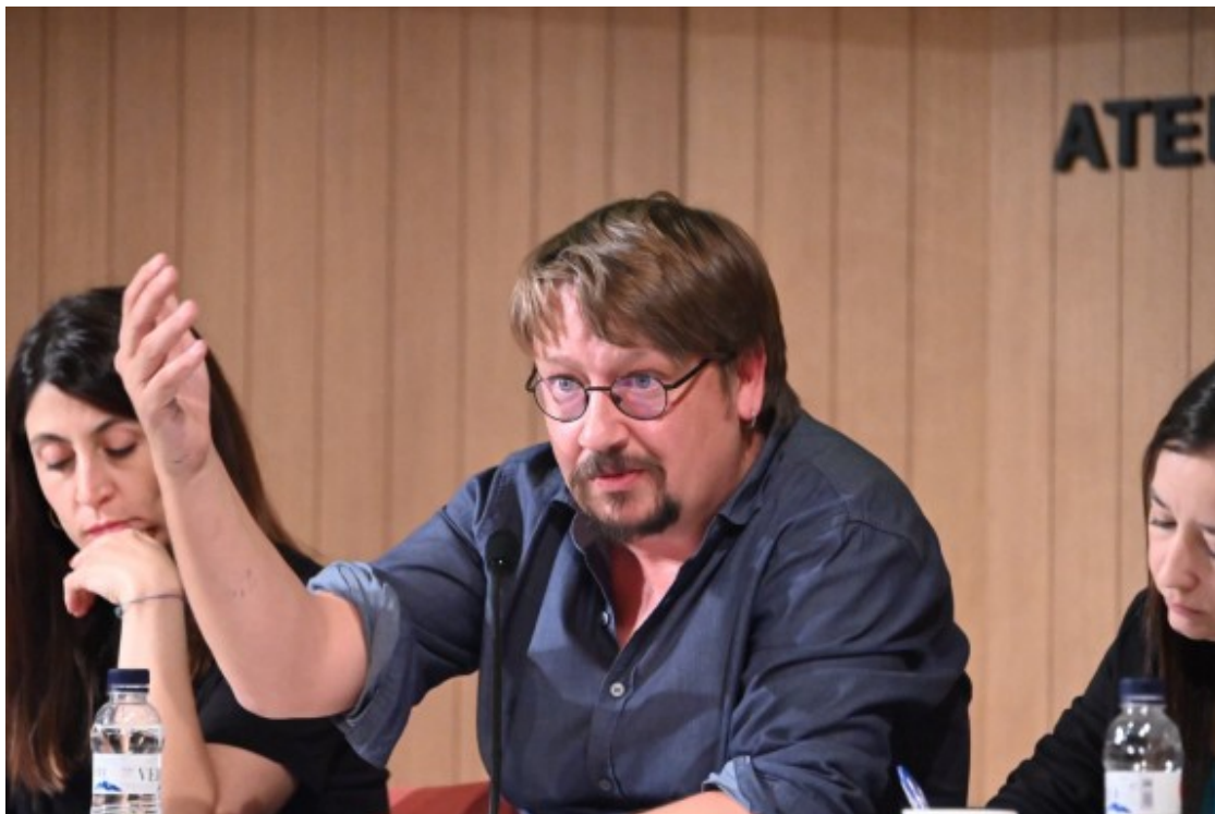
Xavier Domènech, durant la presentació de la revista de Sàpients i Nació Digital sobre la sentència del procés.

- És un procés en què ara mateix es troba en una fase d'escolta que ja s'anirà definint... Tot i això, tant per part dels comuns com de Podem s'ha treballat per avançar en solucions democràtiques en aquest sentit i tinc pocs dubtes que ho continuen fent, però no m'hi atreveixo a aventurar-me.