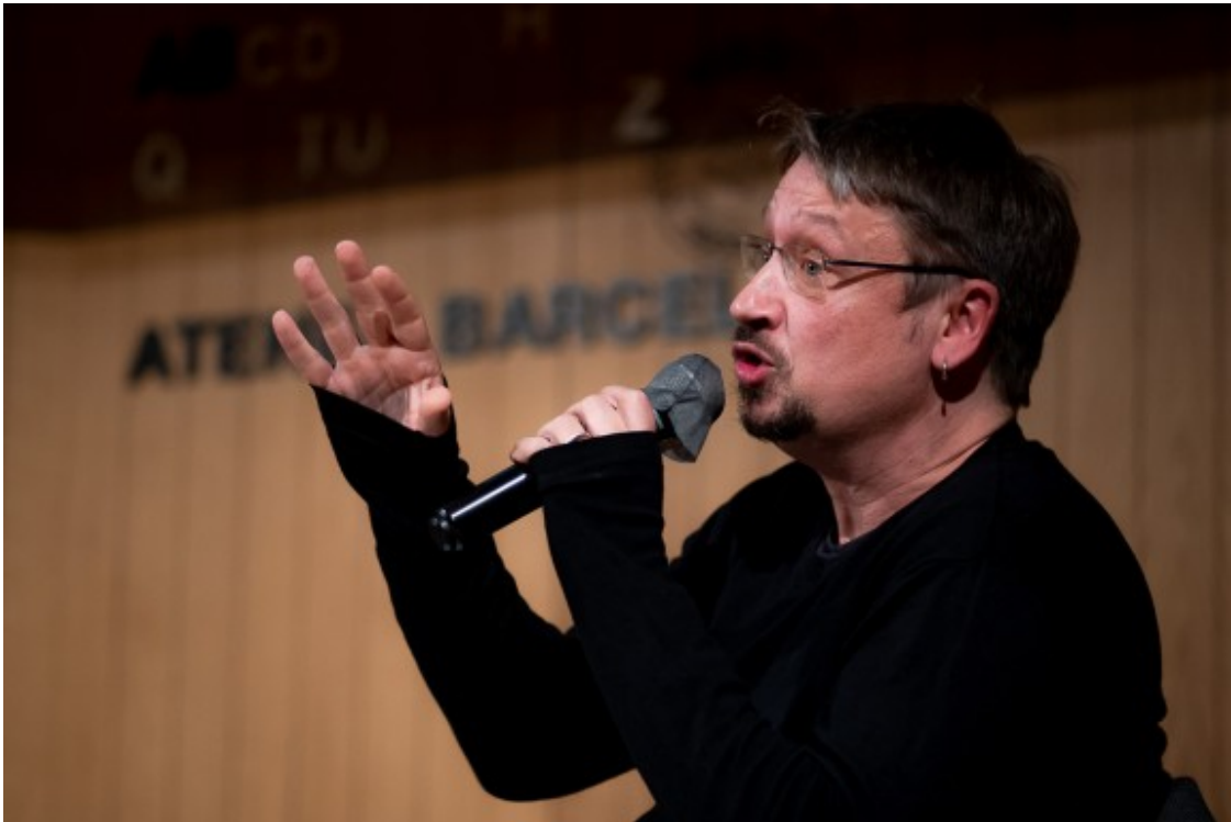
Xavier Domènech, en un acte recent a l'Ateneu Barcelonès.

- No crec que sigui una iniciativa que puguin portar ERC o el president Aragonès ells sols, requereix d'acords amplis. És cert que ara mateix la taula de diàleg està molt centrada en la desjudicialització de la política, però hauria d'avançar molt més amb l'horitzó del 2024, pensant en després de les eleccions espanyoles. Quan et plantejes una negociació, hi ha d'haver un horitzó i clarament, per una part del Govern català i altres actors, aquest és que siguin els catalans i les catalanes aquells que decideixin el seu futur. I això requereix d'acords molt amplis.