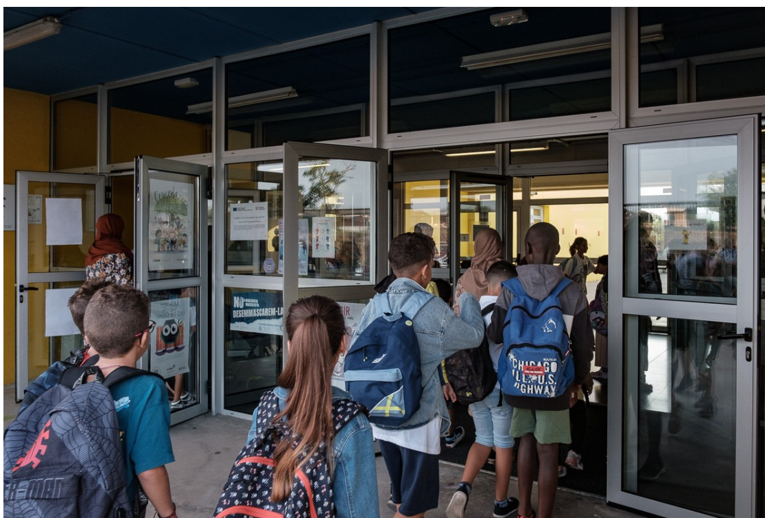
Primer dia de curs a l'Escola Quatre Vents de Manlleu

Equips directius de centres públics de Barcelona, amb suport sindical, veuen inconvenients a l'aplicació pràctica de l'acord amb el Govern i proposen ajornar la incorporació de milers de docents fins al curs que ve