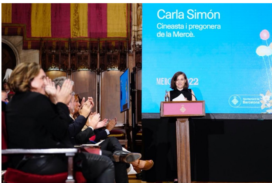
La cineasta Carla Simón, durant el pregó de la Mercè 2022

La cineasta, pregonera de la Mercè 2022, ha representat amb una petita actuació l'aclaparament i dubtes de tot nouvingut en la seva arribada a la capital catalana