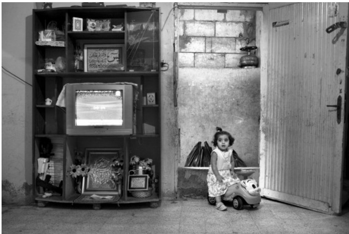
La televisió d'una de les llars del camp de refugiats de Xatila retransmet un partit de futbol en una imatge de 2009

Amb el pas dels anys, però, Xatila, i el conjunt dels refugiats palestins al Líban, va recuperar la pràctica organitzada del futbol amb l'establiment, a partir de 2004, d'una nova competició participada per equips formats per refugiats palestins. Entre ells, hi destaca l'equip de Xatila, batejat com a Karmel 1969, que competeix en una modesta lliga amb els seus homòlegs de d'altres camps i barriades palestines libaneses.