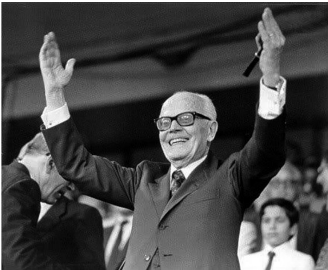
El president italià Sandro Pertini celebra efusivament els gols de la seva selecció a la llotja del Bernabéu durant la final del mundial de 1982

Així i tot, molts palestins refugiats en aquest país mediterrani després de la constitució de l'estat d'Israel , el 1948, van trobar temps, enmig de les tràgiques circumstàncies que els tocava viure, per veure a través de la petita pantalla la final de Madrid que centrava l'atenció del món. La majoria dels palestins que van seguir la final per televisió no eren espectadors neutrals disposats a gaudir de l'espectacle. Ben al contrari, la immensa majoria dels refugiats establerts al Líban no van dubtar en mostrar la seva preferència per una victòria italiana, com ho demostra que el triomf de la squadra azzurra va ser àmpliament celebrat al camp de refugiats de Xatila, situat al Beirut Oest, una de les zones més conflictives del planeta en aquell estiu de 1982.