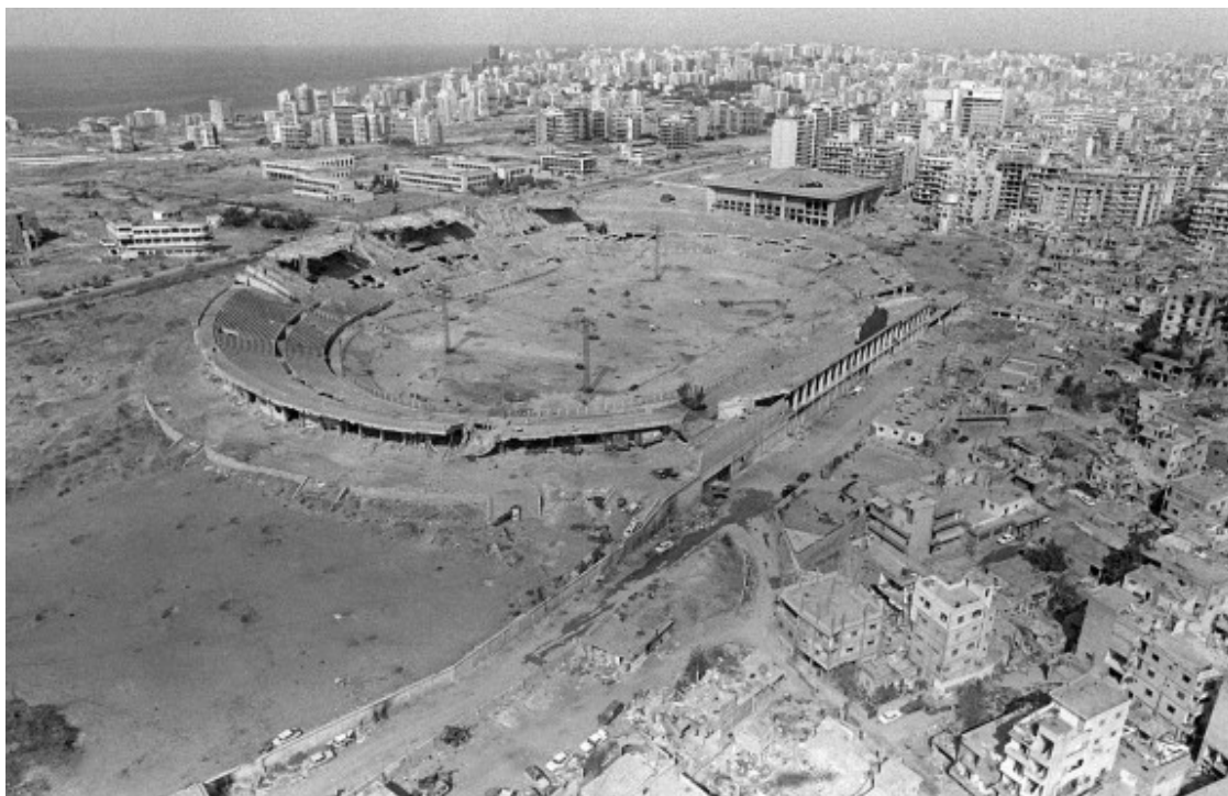
L'estadi Camille Chamoun de Beirtu, completament destruït pels bombardejos de l'exèrcit israelià de l'estiu de 1982

La celebració de la victòria italiana al mundial de 1982, va ser una petita pausa enmig de la tragèdia que vivien els refugiats palestins, que no s'enfrontaven només a l'ocupació israeliana sinó també a l'acció de les falanges cristianes libaneses d'extrema dreta, el Kataeb, que, sota l'empara del Tsàhal, tenia a la comunitat palestina en el seu punt de mira.