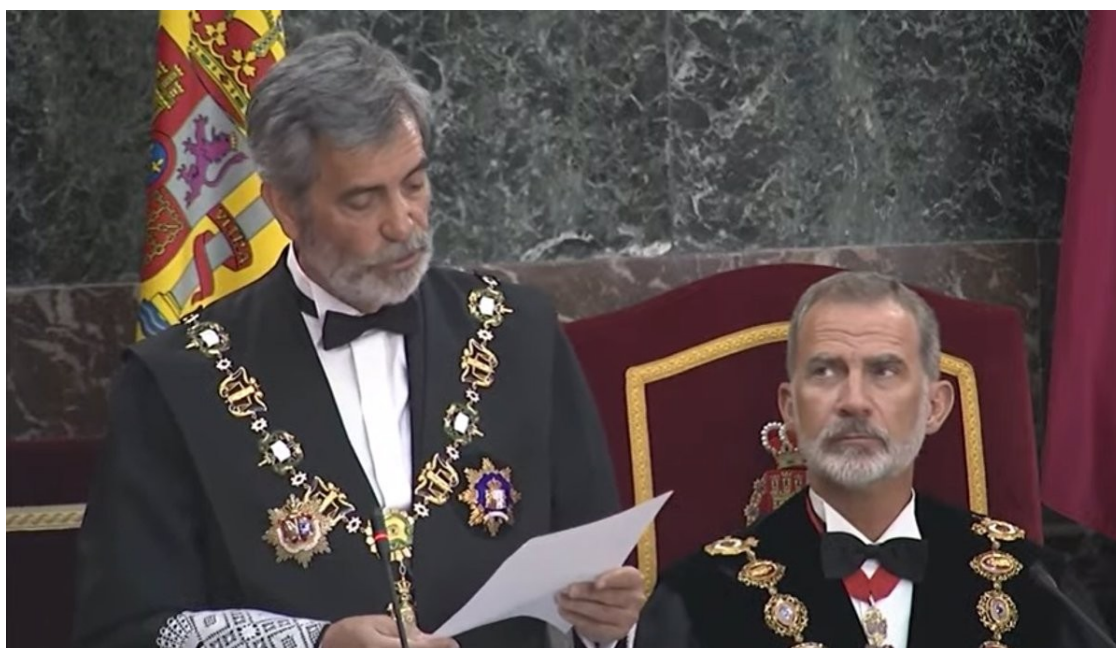
Felip VI escolta Carlos Lesmes en l'obertura de l'any judicial.

Felip VI no ha fet cap gest per posar fi a la greu crisi institucional que suposa la no-renovació del TC i el CGPJ, congelada pel posicionament del PP