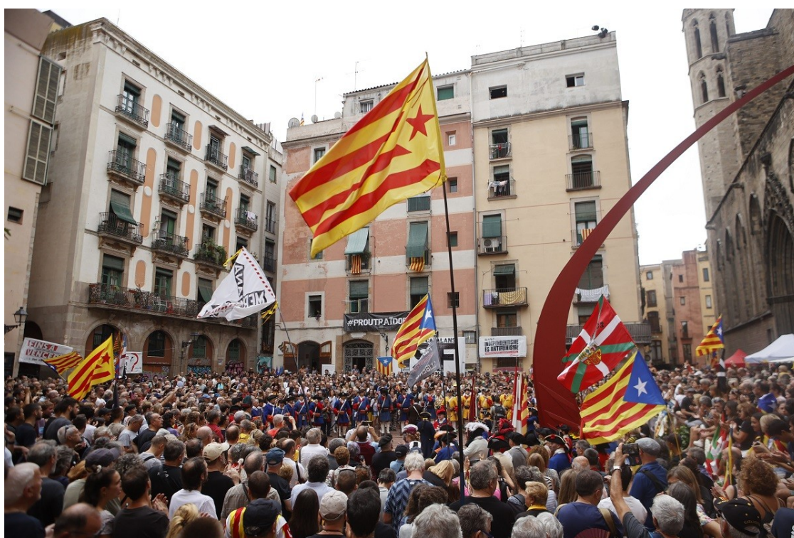
L'independentisme, concentrat al Fossar de les Moreres | Pau Ollé

Tres manifestants habituals de l'última dècada reflexionen sobre si participaran a la mobilització i, en cas que ho facin, quin missatge traslladaran a la cúpula independentista des del carrer