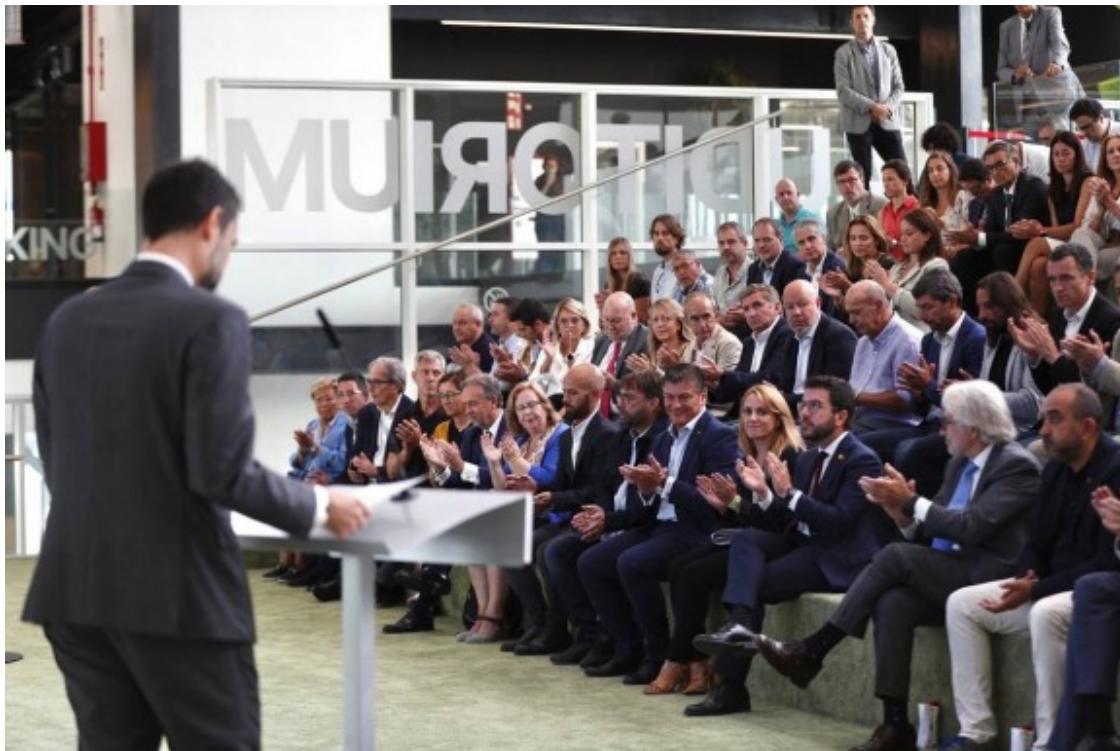
El conseller Roger Torrent a la presentació del Pacte Nacional per a la Indústria

El nou Pacte Nacional per a la Indústria permetrà avançar cap a una indústria més digitalitzada, innovadora, sostenible i generadora d'ocupació de qualitat . En aquest sentit, el conseller d'Empresa i Treball, Roger Torrent i Ramió, assegura que el futur passa per tenir una indústria més competitiva, que inverteixi en innovació, i que incorpori els avenços tecnològics vinculats a la digitalització?.