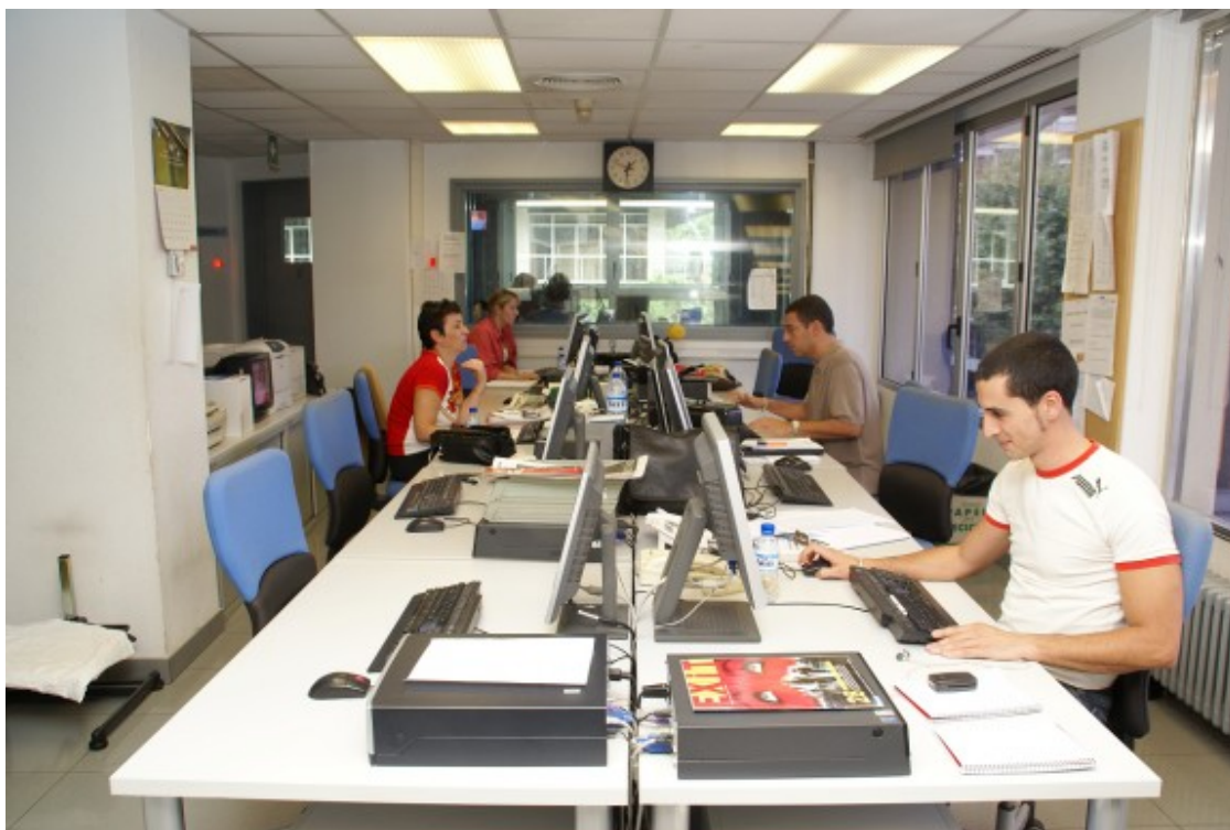
Redacció de Catalunya Informació

Aquesta era, precisament, la principal angoixa que carregava l'equip informatiu: si els espectadors estaven preparats per una forma de consum tan diferent . Era una arma de doble fil: per una banda, donava autonomia als oients, que podien consultar l'actualitat informativa quan volguessin. Ara bé, també existia el risc que trobessin la iniciativa poc atractiva per considerar-la "repetitiva". La sort va somriure a Catalunya Informació i, en paraules de Ramon, es va comprovar que el país "necessita i vol estar informat" .