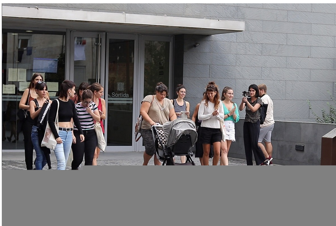
Les deu encausades sortint del jutjat aquest dijous

El judici ha quedat vist per a sentència i la defensa de les encausades considera que s'han vulnerat "drets fonamentals"