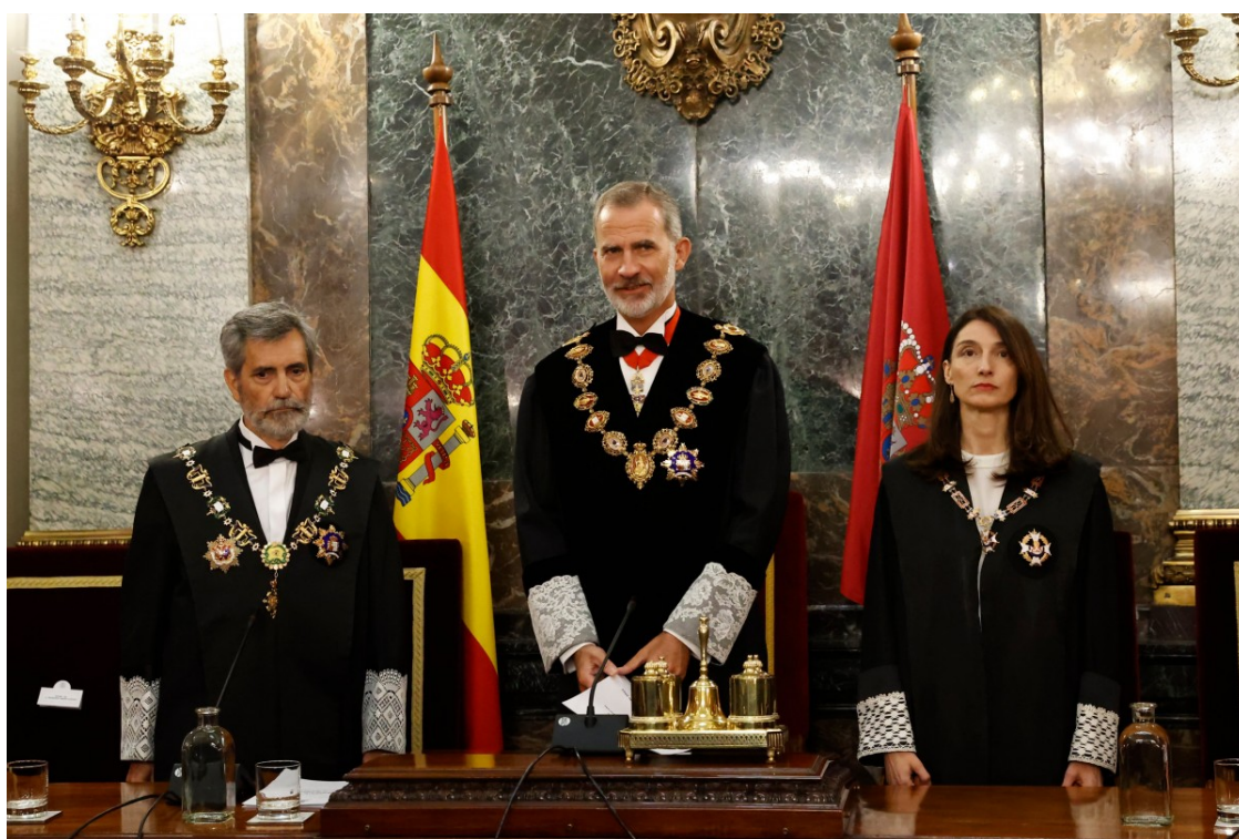
Obertura de l'any judicial a Madrid. | Casa Reial

El president del Consell General del Poder Judicial exigeix al PP i al PSOE que aparquin les discrepàncies per renovar el govern dels jutges: "S'ha de fer amb urgència i el termini no admet interpretacions"