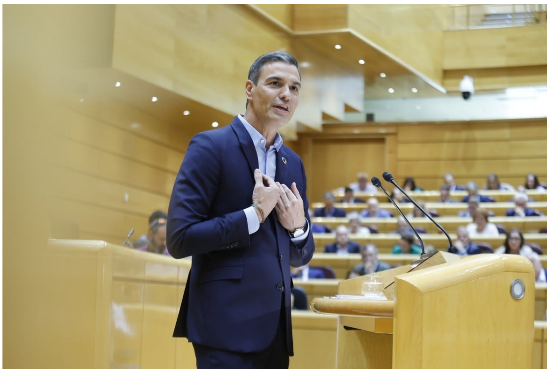
Sánchez, durant la seva intervenció al Senat | ACN

El president espanyol assegura que no hi haurà "mesures dramàtiques com apagades o racionaments" mentre el líder del PP li torna a retreure els pactes amb ERC i Bildu