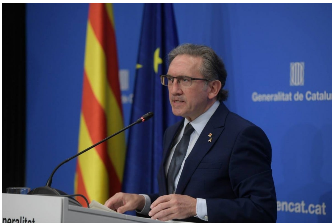
Jaume Giró, al departament d'Economia. | Economia

La xifra, obtinguda a partir d'una aproximació de la conselleria d'Economia elaborada amb dades del 2019 a través del mètode del flux monetari, suposa un 8,5% del PIB català