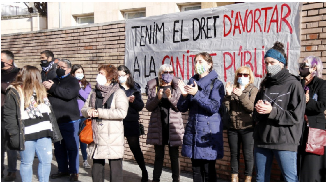
Un grup d'activistes socials reclama un avortament lliure dins de la sanitat pública

La gratuïtat de la píndola del dia després i baixa per regles doloroses són altres aspectes rellevants de la reforma, que ara haurà de superar el debat al Congrés