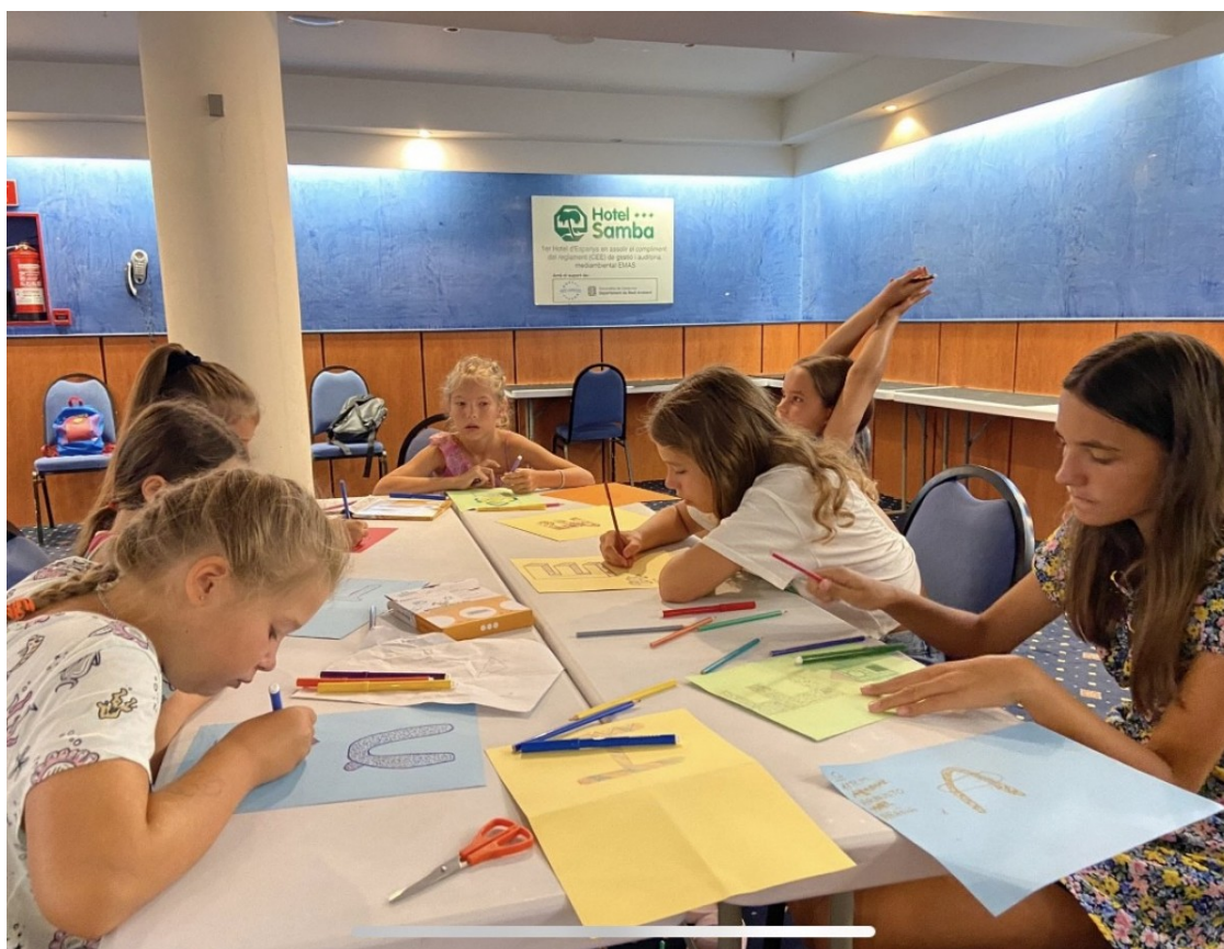
Les participants del programa Temps x Cures a Lloret de Mar

Més de 720 infants i adolescents desplaçats a Catalunya per la guerra d'Ucraïna ja es beneficien d'aquest programa d'acollida i de dinamització socioeducativa