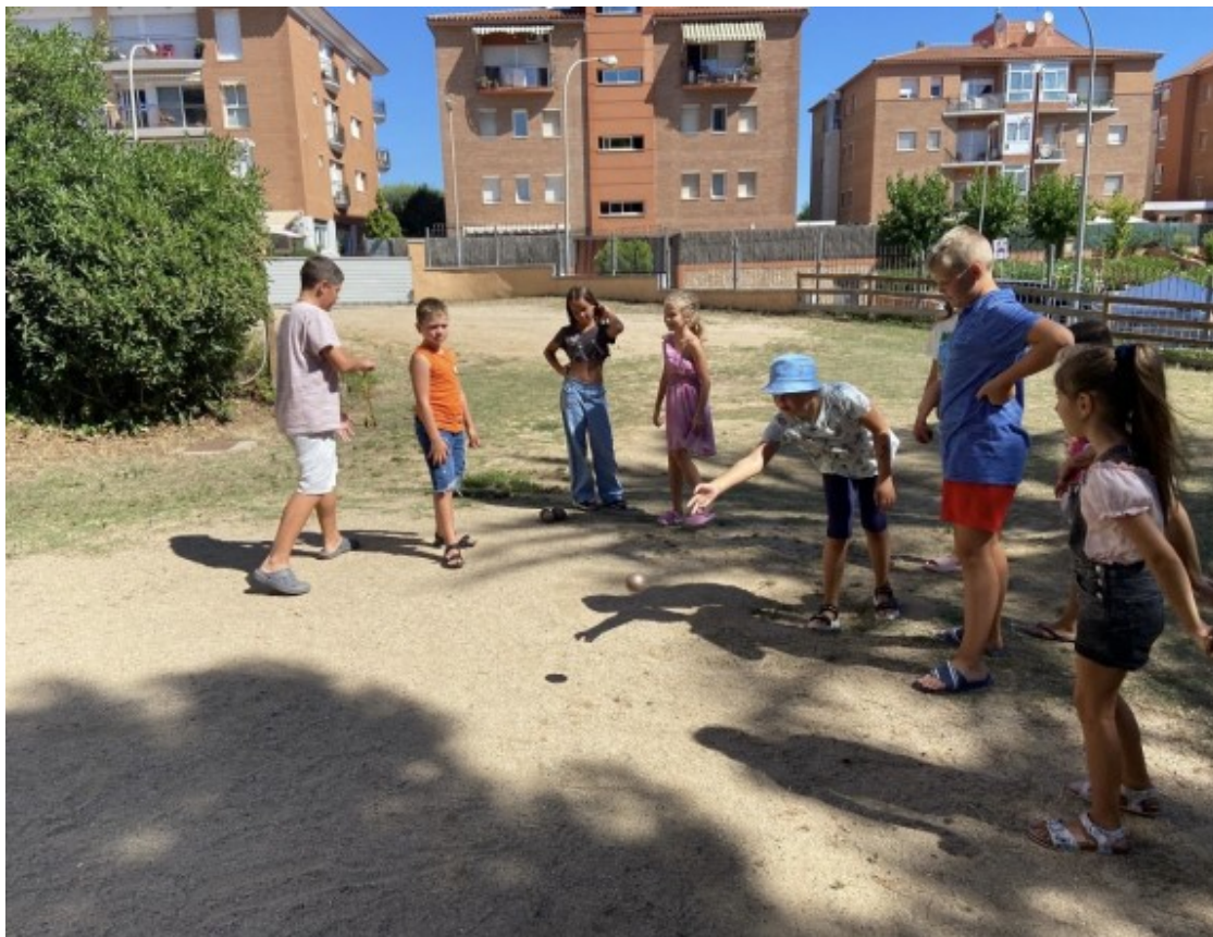
Els serveis de cures d'infants i adolescents desplaçats arran de la guerra a Ucraïna va del 0 a 16 anys

Va néixer així el Temps x Cures Ucraïna, que actualment ja compta amb més de 720 infants i joves participants , que s'està desplegant en diverses àrees territorials de Catalunya ?Terres de l'Ebre, Catalunya Central, Barcelona, Maresme i Garraf, Girona, Tarragona i Lleida? i que s'allargarà fins a finals d'any.