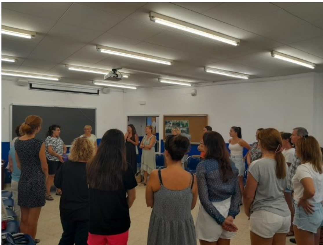
Inici de la formació de monitores a Girona l'1 d'agost

A més de la creació i adaptació dels serveis de cures, l'actuació aprovada preveu la millora de l'ocupabilitat de les persones desplaçades per la guerra d'Ucraïna en el mateix sector. En aquest sentit, està previst que es facin un total de quatre cursos de formació de monitores en el lleure per a l'obtenció de la titulació de monitora o monitor de lleure (125 hores de formació), en els quals es preveu participaran inicialment 120 persones . El de Girona ja va començar l'1 d'agost i la resta es duran a terme a Terres de l'Ebre, Tarragona i Lleida.