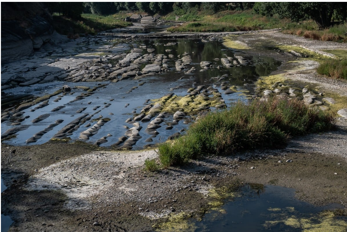
El riu Ter a la zona de Sorralta, a les Masies de Roda. | Adrià Costa

La mesura, que inclou restriccions de l'ús d'aigua, afecta comarques com Osona, el Ripollès, l'Anoia, el Moianès, el Bages i el Berguedà