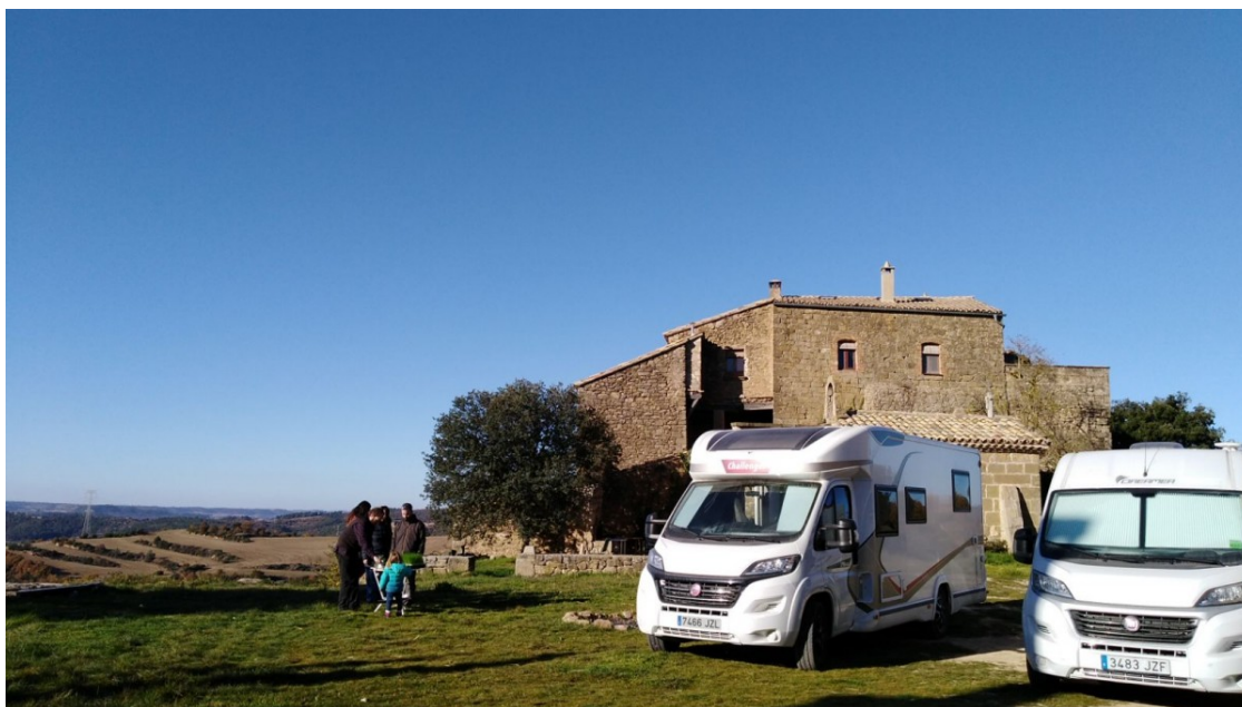
Caravanes en una masia catalana

El model de viatge amb autocaravanes ha augmentat en els darrers anys i ha motivat els ajuntaments a habilitar espais d'acollida per atreure viatgers