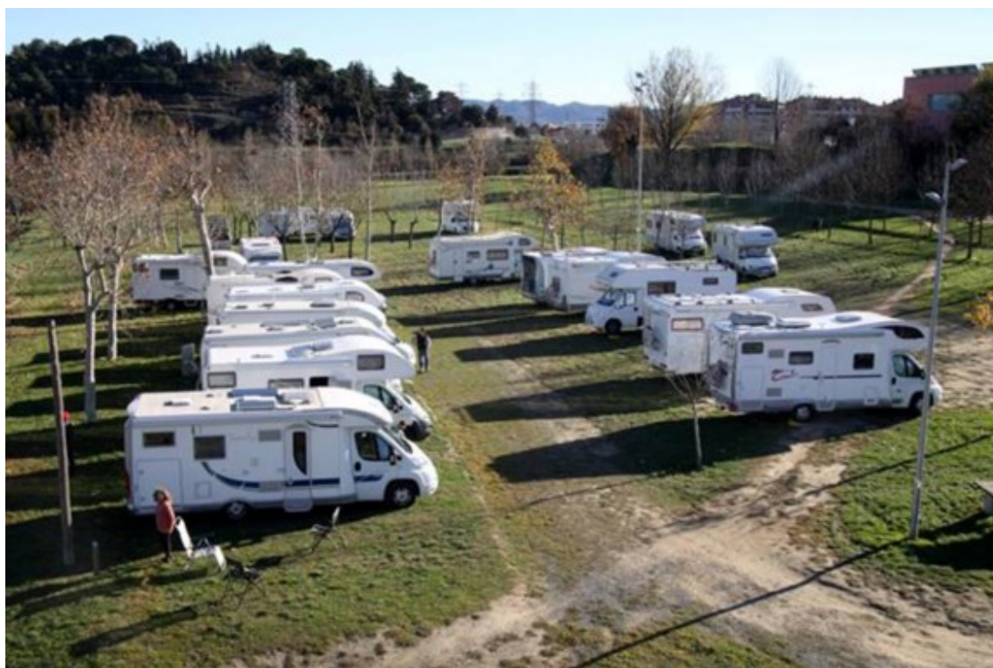
Les zones d'aparcament i serveis són cada vegada més freqüentades.