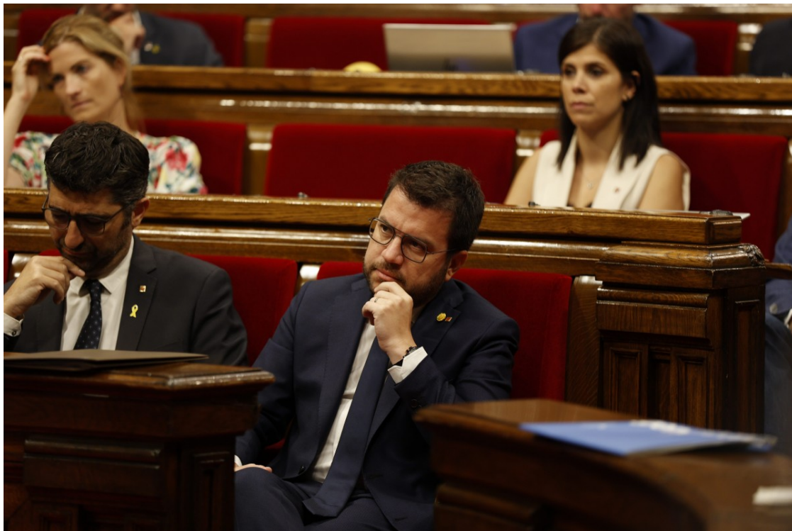
Pere Aragonès, aquest dimecres al Parlament. | Pau Ollé

El president de la Generalitat celebra la mà estesa dels comuns per negociar els pressupostos del 2023 i defensa que les figures fiscals "redistributives" s'han de mantenir