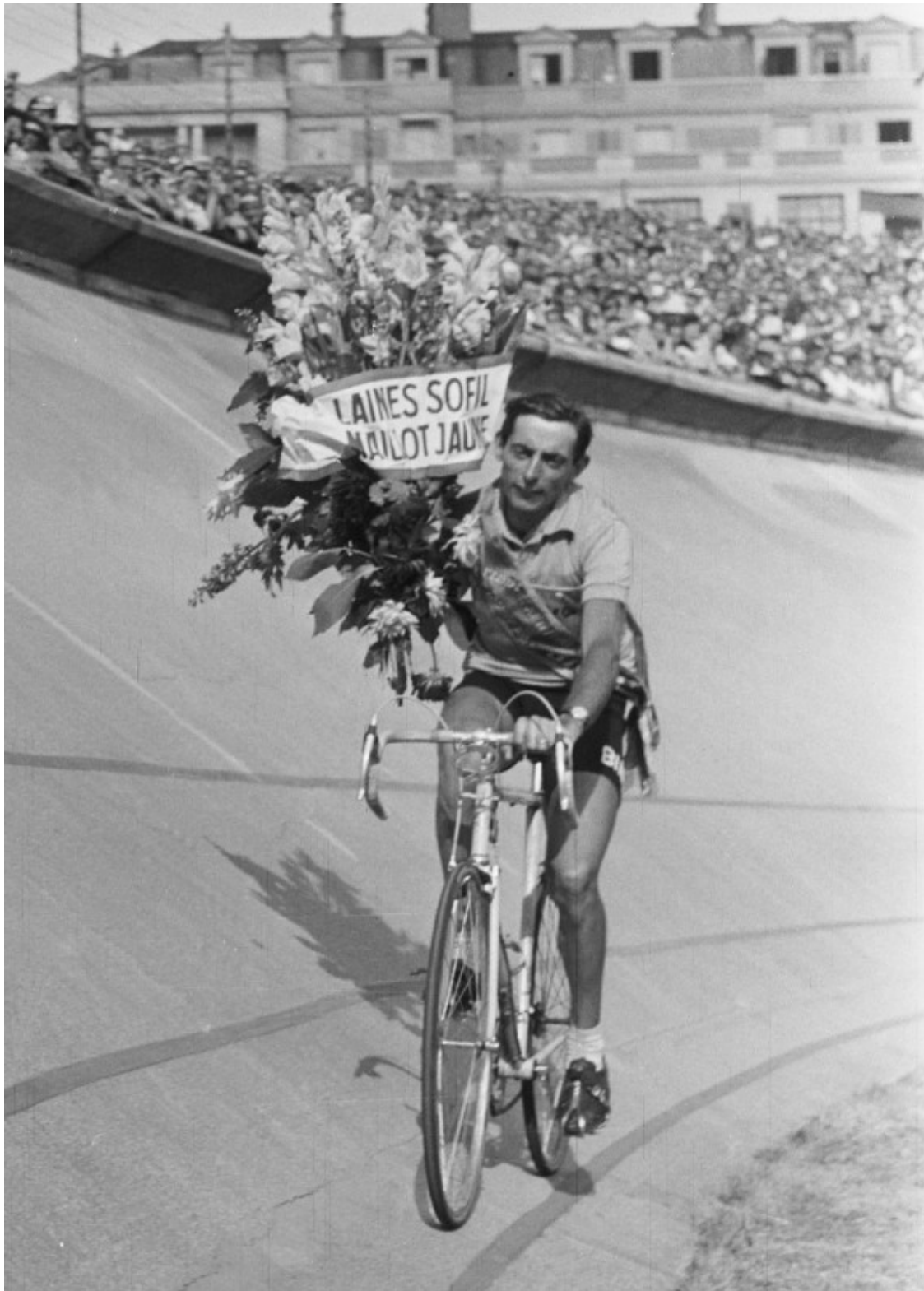
Fausto Coppi celebra el seu triomf al Tour de França 1952