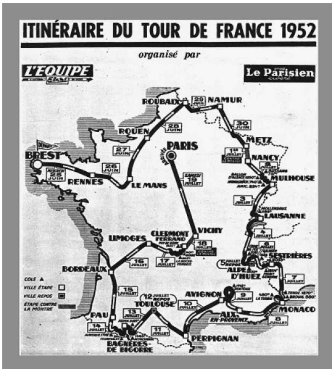
Mapa del recorregut de l'edició de 1952 del Tour de França amb etapa final entre Vichy i París

De fet, aquesta és l'única ocasió en la història del Tour de França en què Vichy ha estat ciutat-etapa. En altres ocasions, com per exemple el 2008, la vila termal va veure com els corredors travessaven els seus carrers però sense ser punt d'arribada o de sortida d'una etapa de la cursa. Aquesta circumstància només es va viure el 1952, quan Vichy va acollir el final de la contrarrelotge que havia sortit de Clermont-Ferrand i l'endemà va ser el punt de partida d'una llarguíssima etapa final del Tour, de 354 quilòmetres, una longitud poc habitual fins i tot per aquella època, que va enllaçar-la amb París.