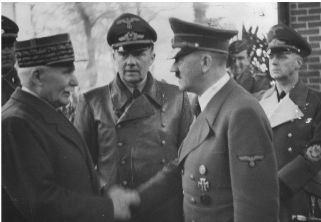
El mariscal Pétain en una trobada amb Hitler el 1940 durant una visita del dirigent nazi a França

Lligat amb aquesta idea de mostrar una imatge diferent de Vichy de la que la ciutat havia projectat durant els anys de l'ocupació nazi , després de la Segona Guerra Mundial les autoritats locals, en complicitat amb el sector turístic, va intentar renovar la vella glòria que havien tingut les seves aigües termals. És en aquest context on cal situar també el pas del Tour de 1952 per la ciutat, que tenia una evident finalitat política, unir França i deixar enrere les seves divisions, però també econòmica, impulsar el turisme termal i recuperar per Vichy la clientela perduda des de la dècada dels quaranta.