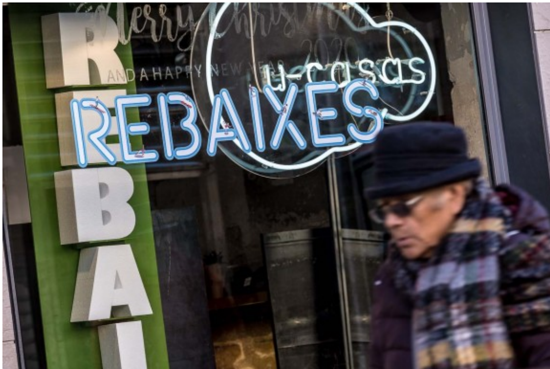
Rebaixes en un comerç de Vic.

Puig afirma que el dia 7 de gener ?era màgic ", quan tothom sortia a mirar els productes amb descompte. El president PIMEComerç, en la mateixa línia, assegura que la imatge de la gent entrant a les grans superfícies "ja no existeix". Goñi recorda que "la rebaixa la fa el client" i, ara, el client, ja troba descomptes "a tot arreu".