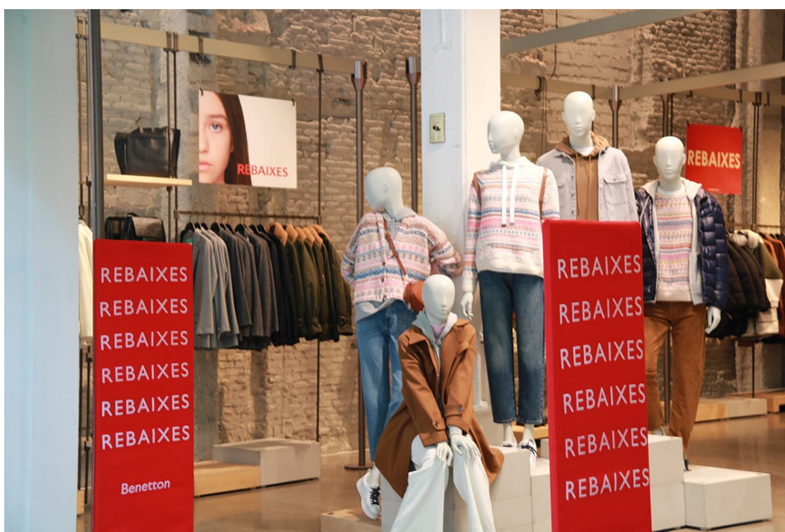
Una botiga de Barcelona de rebaixes

El sector lamenta que les grans plataformes avancin els descomptes i demanen fixar un calendari "clar"