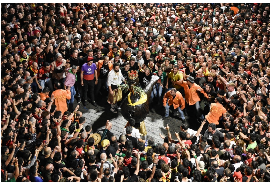
Berga vibra amb la Patum Completa de dijous | Arnau Alcalà

Ajuntament i entitats de Berga anuncien que els concerts previstos es traslladen d'ubicació per complir amb la decisió del jutge