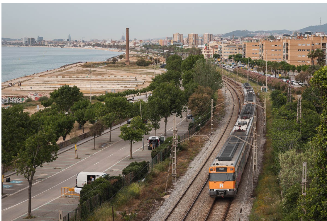
Un tren de Rodalies, en el seu pas per Montgat.

L'executiu català enviarà requeriments formals a dues ministres i a la delegada del govern espanyol a Catalunya per tal de rebre explicacions sobre l'execució pressupostària, que només és un terç de la prevista