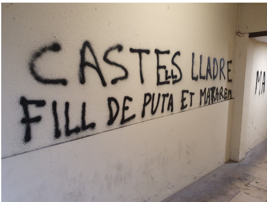
Les pintades al centre d'Igualada

Marc Castells denuncia els missatges contra ell i ho valora com l'odi i el menyspreu cap a la democràcia, civisme i la convivència