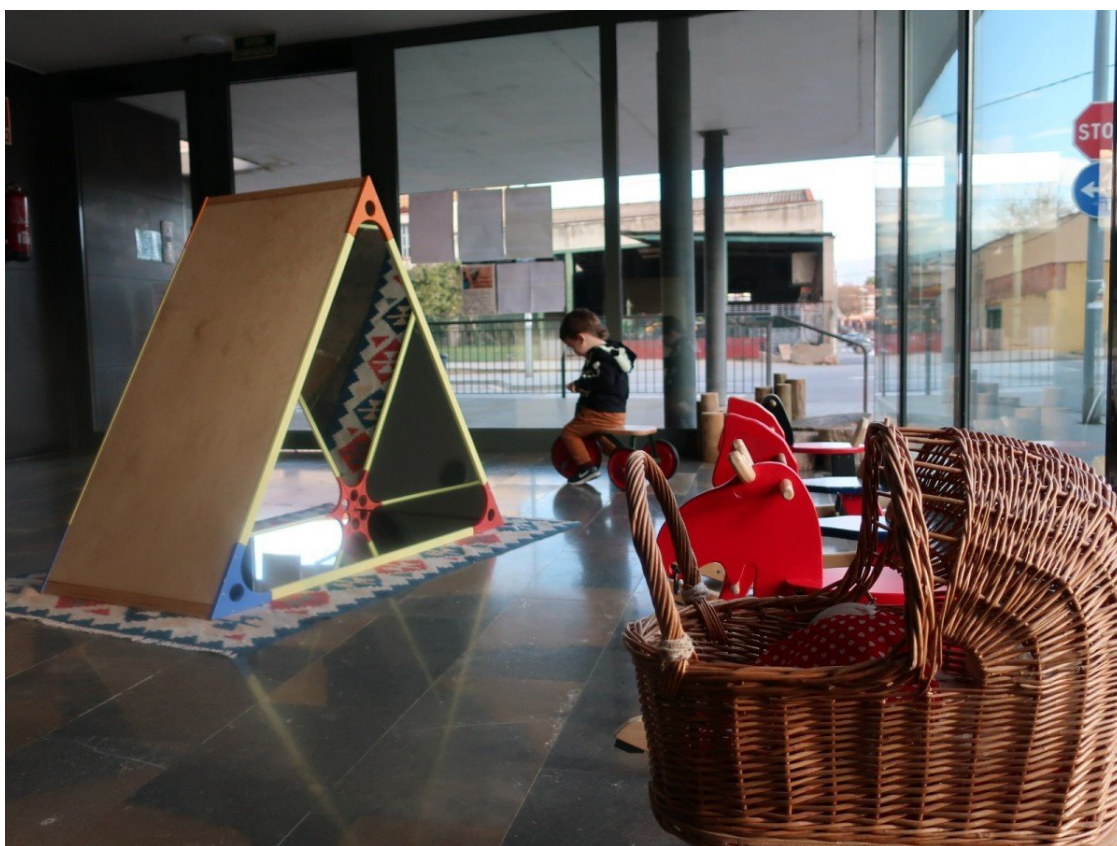
Una aula d'una escola bressol municipal | Ajuntament de Granollers

Educació tanca amb els municipis l'acord per a la "gratuitat" de les llars d'infants: abonarà 1.600 euros per infant i curs als centres públics per abaratir el cost de les famílies